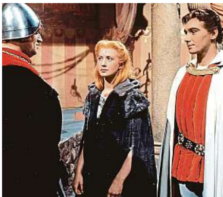
Herečka vlevo na snímku z roku 2009, vpravo ve své životní roli