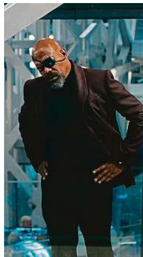
Samuel L. Jackson v letošním propadáku Marvels FALCON

Místo toho se Jackson soustředil na hereckou dráhu, zpočátku tedy na divadlo. Výrazného Jacksona, který podle kritiky umí hrát i jen očima, si v osmdesátých letech všiml