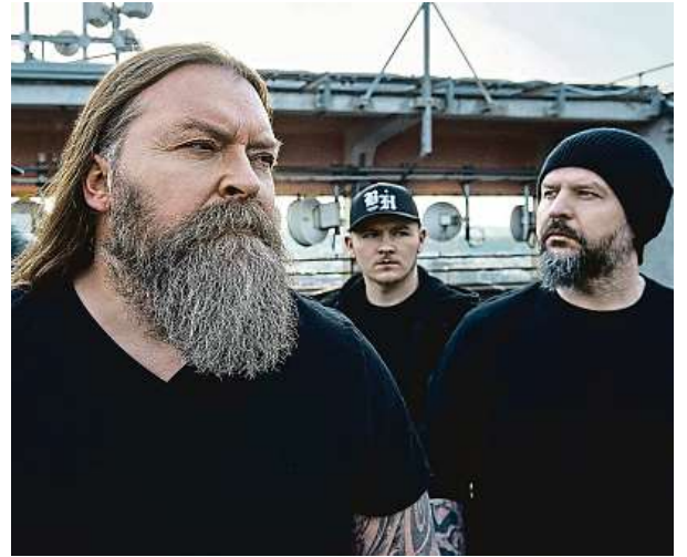
Sobě i svému tempu věrní Škworci zůstanou rozhodně i v nadcházejícím roce.

TK: Ale takhle nad tím vůbec neuvažujeme! Na začátku je nějaká kytarovej nebo basovej nápad, kterej se nahráje, a dál se může různě vyvíjet. Buď to hodíme do nějaké tvrdší, nebo naopak elektroničtější podoby, možností je spousta. S každou písničkou si můžeš všelijak vyhrát. Elektronika nás určitě baví, ale nepřemýšlíme nad tím způsobem: „Ty bláho, musíme tam dát spoustu samplů... Jde o to, jak té písničce pomoci, ale neublížit.“