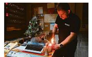
Kdysi přísně utajovaný objekt ČTK

Vůně cukroví a jehličí i melodie koled se ponosou na Štědrý den rozlehlými útroby bývalého protiatomového bunkru z dob studené války, který byl vybudován u Přáslavic na Olomoucku a patřil mezi přísně utajované vojenské objekty zajišťující spojení s Moskvou. Majitelé připravili i speciální vánoční prohlídku bunkru, jehož vrata veřejnosti otevrou i v závěru roku. Při prohlídce bunkru se návštěv-