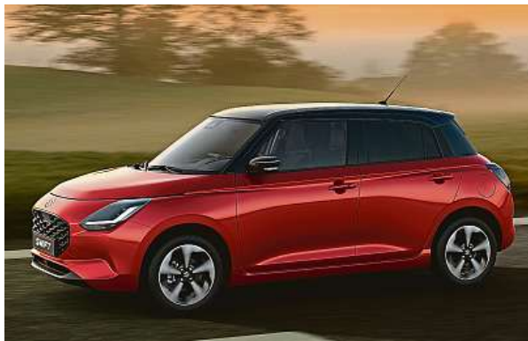
Suzuki uvádí čtvrtou generaci městského Swiftu. Do Evropy vstupuje s jediným motorem a pohonem všech kol.

Leskle černá maska chladiče a diodový pás denního svícení ve tvaru L navazují na výrazný podélný prulis, který obepíná celou karoserii. Vystoupilé lemy blatníků ještě více zdůrazňují tyto stylové prvky.