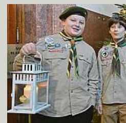
Světlo donesli skauti. MHMP