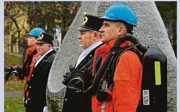
Pietní akt k uctění památky obětí důlního neštěstí