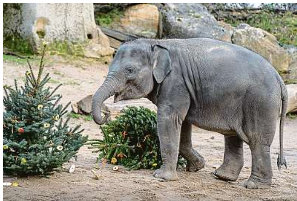
Stromky potěší třeba gorily, papoušky nebo slony.

Mimochodem, až do 26. prosince mohou lidé do pražské zoo nosit zvířatům jedlé dárky. Vítaná jsou jablka, mrkev či neslazené suché pečivo. Mezi svátky se