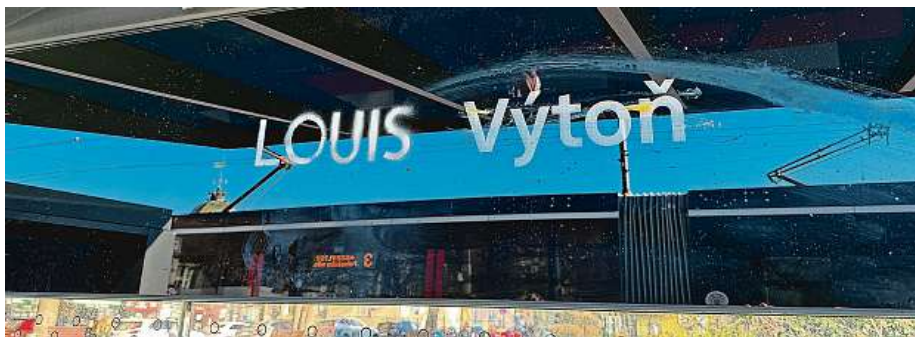
Louis Vuitton, na niž nápis rovněž odkazuje, je francouzská módní oděvní značka založená v roce 1854 návrhářem téhož jména. Značka je velmi známá pro svůj monogram LV. METRO