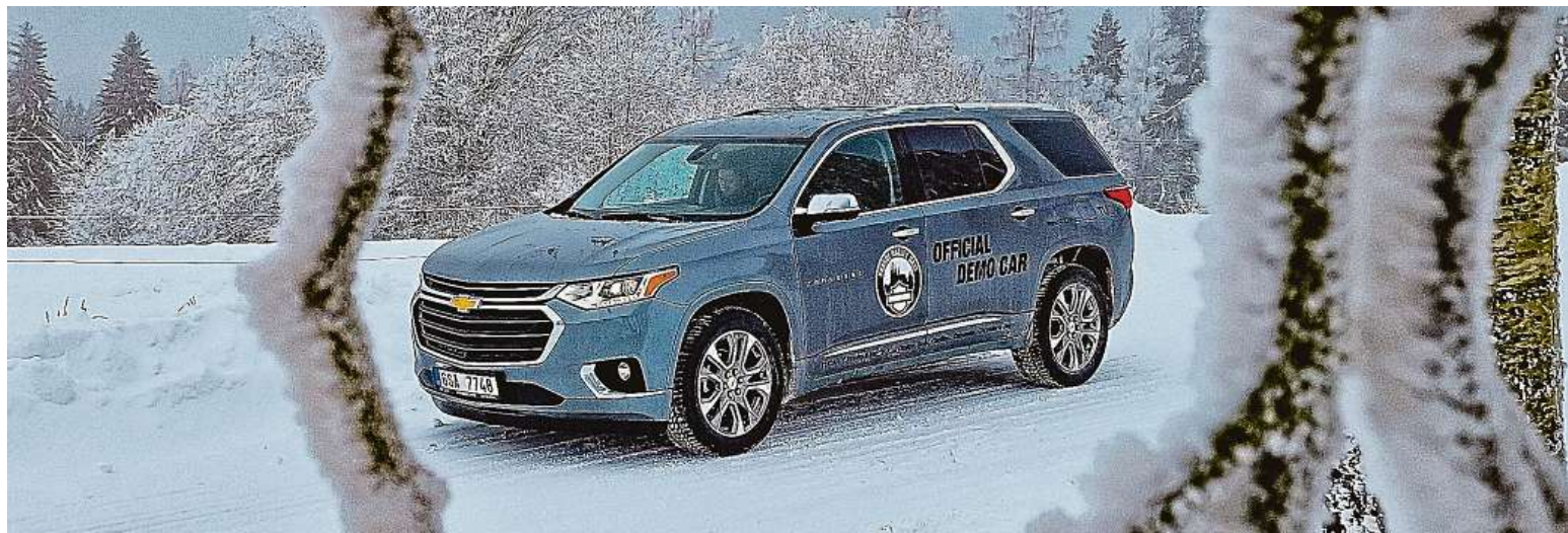
Mix SUV a MPV. To, co je pro Čechy Kodiaq, je pro Američany tohle. Chevrolet Traverse, 5,2 metru dlouhé sedmimístné SUV s atmosférickým šestiválcem. Proč ne.