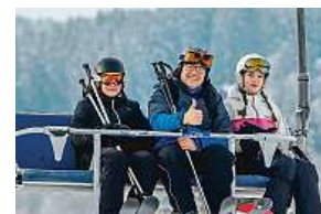
Lipno, 8. prosince