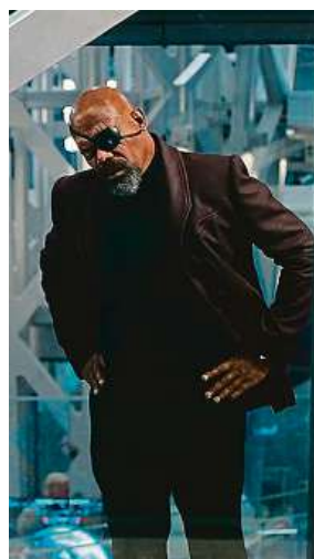
Samuel L. Jackson v letošním propadáku Marvels FALCON

Místo toho se Jackson soustředil na hereckou dráhu, zpočátku tedy na divadlo. Výrazného Jacksona, který podle kritiky umí hrát i jen očima, si v osmdesátých letech všiml