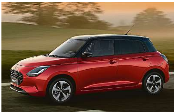
Suzuki uvádí čtvrtou generaci městského Swiftu. Do Evropy vstupuje s jediným motorem a pohonem všech kol.

Leskle černá maska chladiče a diodový pás denního svícení ve tvaru L navazují na výrazný podélný prulis, který obepíná celou karoserii. Vystoupilé lemy blatníků ještě více zdůrazňují tyto stylové prvky.