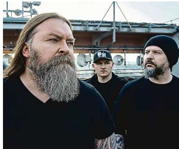
Sobě i svému tempu věrní Škworů zůstanou rozhodně i v nadcházejícím roce.

TK: Ale takhle nad tím vůbec neuvažujeme! Na začátku je nějaký kytarovej nebo basovej nápad, kterej se nahráje, a dál se může různě vyvíjet. Buď to hodíme do nějaké tvrdší, nebo naopak elektroničtější podoby, možnosti je spousta. S každou písničkou si můžeš všelijak vyhrát. Elektronika nás určitě baví, ale nepřemýšlíme nad tím způsobem: „Ty bláho, musíme tam dát spoustu samplů... Jde o to, jak tě písnička pomůže, ale neublíží.“