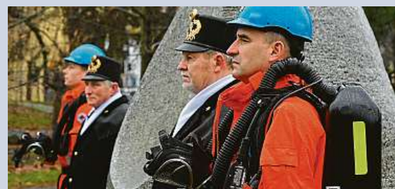
Pietní akt k uctění památky obětí důlního neštěstí