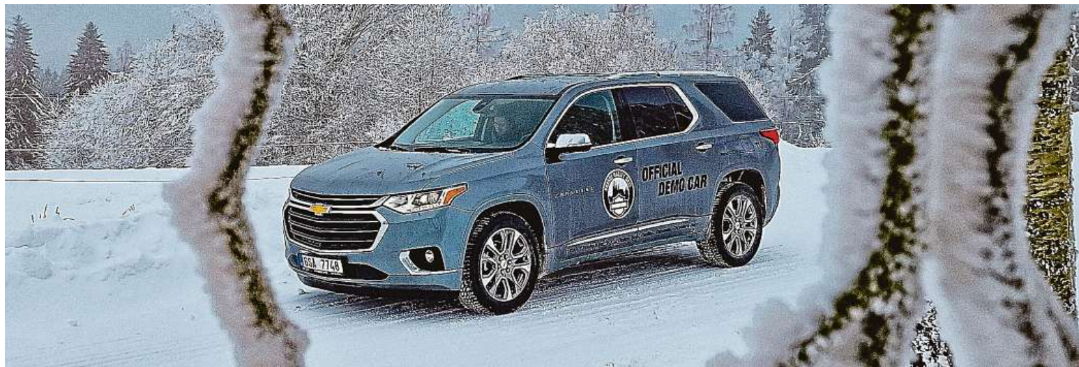
Mix SUV a MPV. To, co je pro Čechy Kodiaq, je pro Američany tohle. Chevrolet Traverse, 5,2 metru dlouhé sedmimístné SUV s atmosférickým šestiválcem. Proč ne.