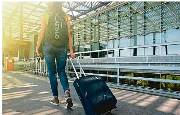
Češi v letošním roce nejčastěji kupovali letenky v úterý večer a nejméně v neděli.

Poptávka v novém roce se dá očekávat stejně vysoká jako letos, může dále i mírně růst.