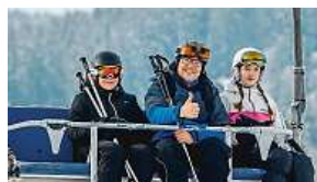
Lipno, 8. prosince