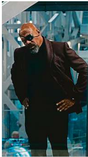
Samuel L. Jackson v letošním propadáku Marvels FALCON

Místo toho se Jackson soustředil na hereckou dráhu, zpočátku tedy na divadlo. Výrazného Jacksona, který podle kritiky umí hrát i jen očima, si v osmdesátých letech všiml