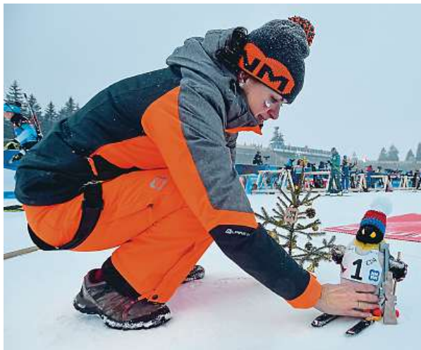
Těsně před závody se na střelnici „usadil“ i její maskot.