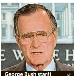
George Bush starší

Bývalý šéf Bílého domu svoji identitu před obdarovaným tajil.