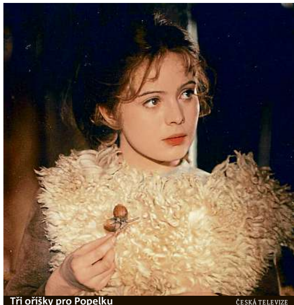
Tři oříšky pro Popelku