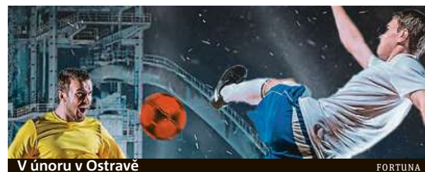
V únoru v Ostravě

Určitě velkou netradiční fotbalovou akci. Chtěli jsme fanouškům fotbalu připravit zábavu i v nestandardním fotbalovém počasí a podmínkách. Začneme tedy fotbalovým turnajem na sněhu, ale nebude to jediná akce, kterou máme připravenou.