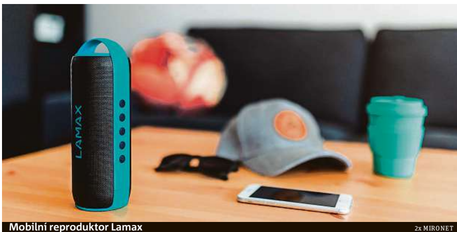
Mobilní reproduktor Lamax

MusiCan1 obsahuje stereoreproduktory o celkovém výkonu 12 W, které bez problému ozvučí větší místnost i terasu. Produkovaný zvuk je na tak malé zařízení na výborné úrovni. Basy jsou hut-