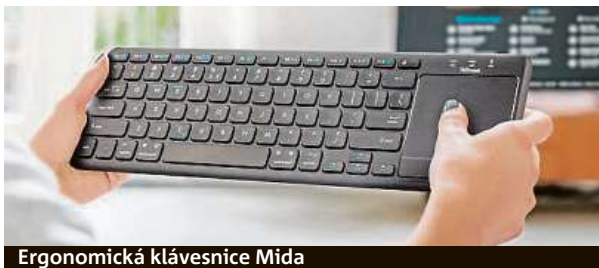
Ergonomická klávesnice Mida

Na volání uživatelů po podobném zařízení odpověděl