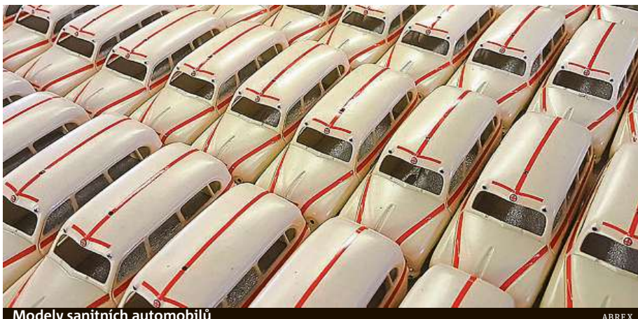
Modely sanitních automobilů

„Dovoz proclívaných hraček před Vánocemi stoupl o 21 procent. Mezi hlavní vývozce patří Čína, u části se jedná také o Hongkong a Vietnam. U dovážených hraček si musí dovozci dát pozor na ochranu obchodních značek, což platí dokonce i pro modely autíček s logem příslušné automobilky. Překvapením jsou pro nás dovozy tištěných knih, které vyskočily o 12 pro-