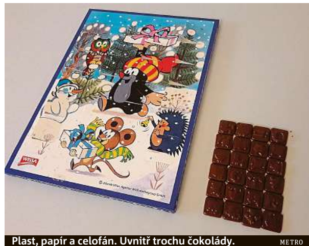
Plast, papír a celofán. Uvnitř trochu čokolády.

Alternativa běžného kalendáře je například kolíčkový kalendář. Dvacet čtyři kolíčků drží drobné dárečky. Jeho konkrétní podobu najdete na ekovanoce.cz. MAREK HÝŘ