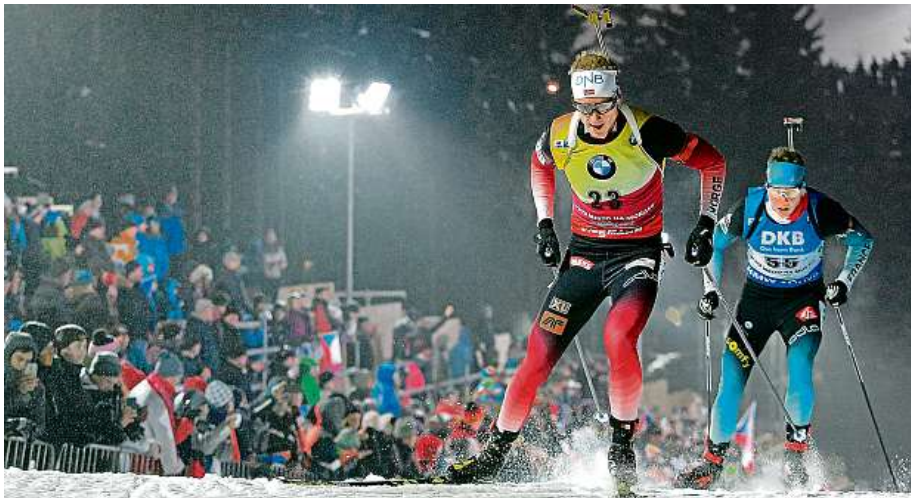
Za nočního osvětlení se podél trati včerejšího sprintu mužů tísnilo víc než 22 tisíc diváků.