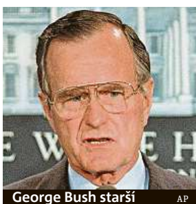
George Bush starší

Bývalý šéf Bílého domu svoji identitu před obdarovaným tajil.