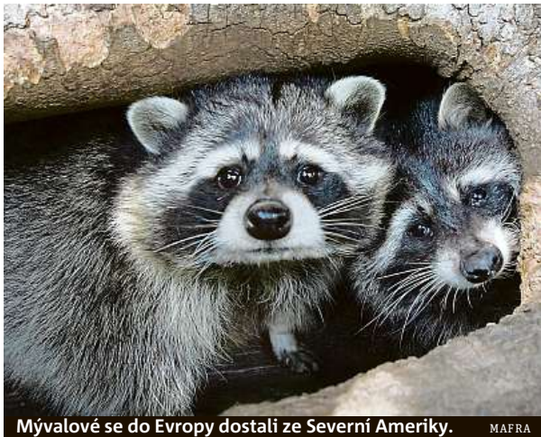
Mývalové se do Evropy dostali ze Severní Ameriky.

Zvířata nakažená vzteklinou jsou velkým nebezpečím. Virus vztekliny může napadnout centrální nervovou soustavu, což může skončit i smrtí. Není proto s podivem, že když obyvatelé amerického města Milton viděli podivně se chovající mývaly, zavolali policii. Strážci zákona začali sledovat oblast, kde se podezřelá zvířata pohybovala. Ovšem když se jim dva podařilo odchytit, zjistili, že mají problém s něčím jiným než se vzteklinou. Mývali nebyli