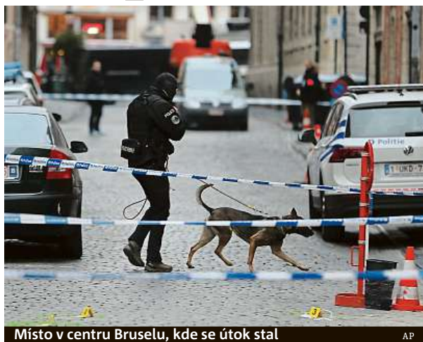
Místo v centru Bruselu, kde se útok stal

Policista utrpěl zranění na krku a byl převezen do nemocnice, jeho zranění je ale jen lehké. Těžké zranění napopak utrpěl útočník, kterého kolegové napadeného strážníka postřelili. „Je příliš brzy na to, abychom řekli, jaký byl