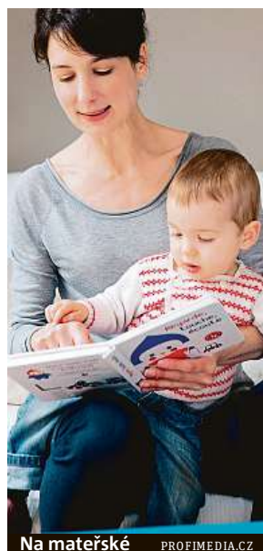
Na mateřské

Dřívějšímu návratu do práce napomáhají také moderní technologie. Díky internetu, mobilům a počítačům může stále více profesí pracovat na dálku, například ze své domácnosti. Nejedna firma tak nechá například svou účetní, marketingovou