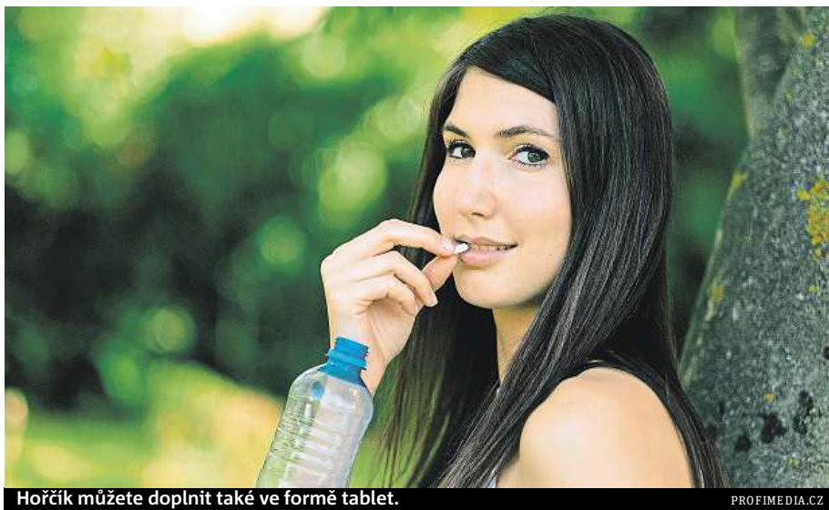
Hořčík můžete doplnit také ve formě tablet.

Hořčík je nepostradatelný téměř pro všechny procesy, které v lidském těle probíhají. Tím nejdůležitějším je tvorba energie. Udržuje buňky zdravé a zpomaluje jejich stárnutí a odumírání. Podílí se na transportu cukrů do buněk a zlepšuje využití kyslíku v nich. Velmi důležitý je pro diabetiky – téměř polovina lidí trpících cukrovkou druhého typu má nízké hodnoty tohoto minerálu v krvi. Přitom jeho nedostatek snižuje schopnost inzulínu udržovat hodnoty krevního cukru v normálu.