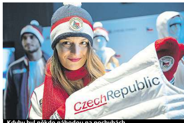
Kdyby byl někdo náhodou na pochybách...