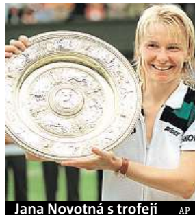
Jana Novotná s trofejí

Wimbledonská vítězka z roku 1998 podlehla ve 49 letech rakovině.