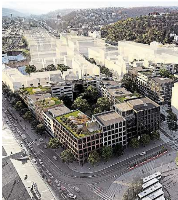
Takto bude Smíchov City vypadat.

Celkem 166 architektonických studií zareagovalo na výzvu České spořitelny, která vypsalala soutěž o podobu své centrály právě ve Smíchov City. Vybrala 15 z nich.