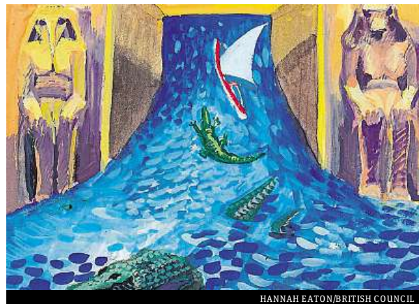
HANNAH EATON/BRITISH COUNCIL

5. .... After many weeks' travel, he came to Elephantine Island. He found Khnum had closed the wooden doors of his house to stop the river escaping to the sea. He ordered food and sweet wine to be brought to Khnum's house. He built a new temple for Khnum. Khnum opened the doors of his house to let the river flow again. The god promised that, in future, the waters of the Nile would always flow and each year they would flood the land. ANDY KEEDWELL