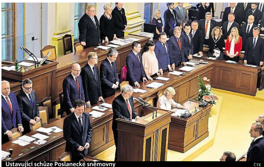
Ustavující schůze Poslanecké sněmovny

nitním výboru,“ řekl šéf TOP 09 Miroslav Kalousek. Proti návrhu komunistů vystoupil předseda klubu Pirátů Jakub Michálek. Vadí mu, že je z toho patrná snaha, aby výbor, který bude mimo jiné znovu rozhodovat o vydání Andreje Babiše a Jaroslava Faltnýka ke stíhání, vedl komunist, tedy zástupce „kvaziopozice“ proti vznikající vládě. Šéf hnutí ANO Andrej Babiš včera také zopakoval, že vítěz voleb nedostal šanci na sestavení většiny, protože ostatní strany spolupráci striktně odmítly. Také uvedl, že se neuskuteční schůzka se sestavou čtyř pravicových stran – Demokratickým blokem, který Babiš označil s odkazem na předsedu TOP 09 za Kalouskův blok. IDNES.cz