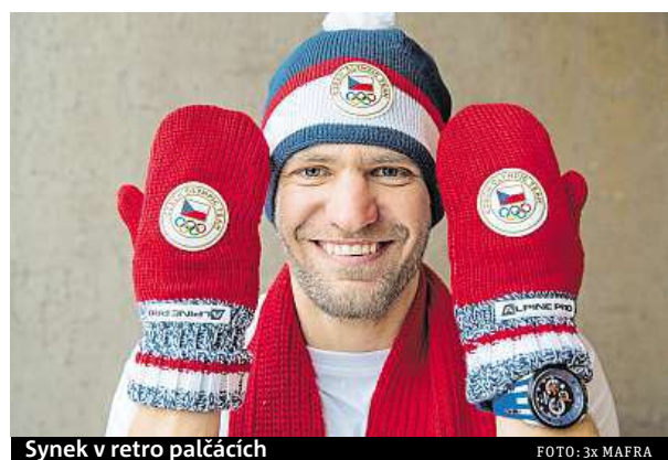
Synek v retro palčáčkách