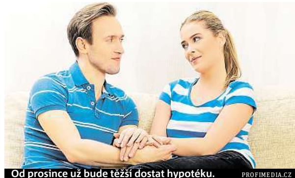
Od prosince už bude těžší dostat hypotéku.

V Plzni lidé dají za nový byt 2+kk průměrně 2,3 milionu korun, za rok cena stoupla minimálně o 15 procent. Vzhledem k nedostatku bytů je lidé kupují ještě dřív, než je developeri dokončí. V Pardubicích se ceny bytů dostaly podle makléřů k maximum. Dvoupokojové byty tam zdražily od června do listopadu