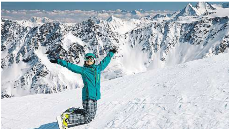
Užijte si Sölden. Oblíbil si ho i představitel nového Jamese Bonda – Daniel Craig.

Dva místní ledovce – Rettenbach a Tiefenbach – patří mezi nejvyhledávanější skiareály v Evropě. Právě tady garantují až do konce zimy super prašánek. Navíc tu přibývají nové a ještě rychlejší lanovky, takže si užijete víc času na sjezdovkách než ve frontách.