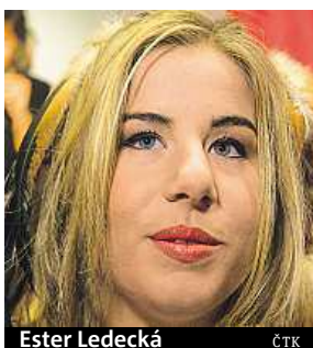
Ester Ledecká

Na prkně jela Ledecká závod naposledy v Soči, kde skončila šestá a sedmá, a na lyžích v polovině dubna. Porovnat se s konkurencí měla v říjnu na soustředění v ame-