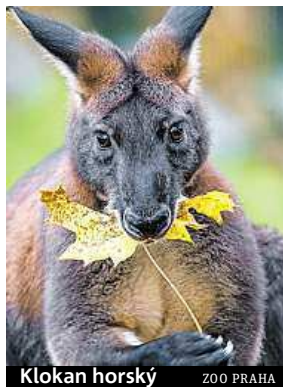
Klokan horský ZOO PRAHA

Podzimní měsíce v trojské zoo si užívají jak zvířata, tak návštěvníci. A také v tomto období jsou k vidění nové, roztomilé přírůstky, momentálně například mláďata surikat, kotě kočky rybářské nebo mládě klokana horského, které začíná opatrně vykukovat ven z tepla břišního vaku své matky. Na návštěvníky čeká také bohatý program. O víkendech probíhají pravidelná komentovaná krmení a na sobotu jsou připraveny adventní dílny. ROW