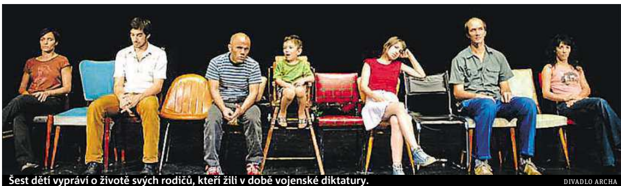
Šest dětí vypráví o životě svých rodičů, kteří žili v době vojenské diktatury.