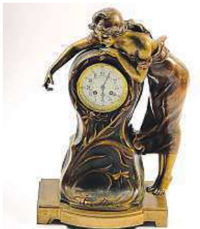
Horodiny s dívkou

Za nejlepší expozici Veletrhu Antique označila odborná porota expozici Galerie Kodl. Ta na veletrhu představuje mimo jiné obraz Františka Kupky Před obrazem. Cena za nejlepší exponát pak putuje aukčnímu domu European Arts, který na veletrhu vystavuje obraz malíře Františka Dvořáka (Brunnera) Strážný anděl. Na více než padesát stáncích zastoupených na veletrhu je k vidění nejširší škála starožitností, tentokrát pře-