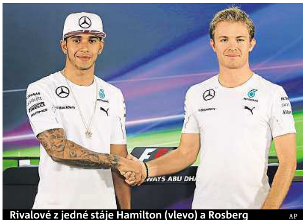
Rivalové z jedné stáje Hamilton (vlevo) a Rosberg

Aby se britský pilot nemusel ohlížet na výsledek týmového kolegy z Mercedesu a jediného konkurenta Nica Rosberga z Německa, musí