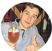
Peet Smooky Kouřil Staromák, ale tenhle rok se podíváme do Drážďan.