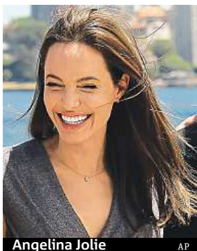
Angelina Jolie

Hollywoodská hvězda Angelina Jolie prý plánuje „po několika dalších“ filmech skončit s herectvím a soustředit se výhradně na režisérskou roli. Herečka to řekla v australském Sydney, kam tento týden přijela se svým manželem Bradem Pittem na premiéru svého nového snímku Nezlomní. Drama z druhé světové války, jež vypráví skutečný příběh olympijského běžce Louise Zamperiniho zajatého japonskými vojáky během druhé světové války, natáčela právě v Austrálii. Byl to druhý režisérský počín Jolie po snímku V zemi krve a mechu z roku 2011, který kritiky přijaly velmi pozitivně. „Ráda projekt sleduji po celou dobu vývoje. Baví mě strávit dva roky nad nějakým tématem, dozvídat se o něm,“ uvedla. Jolie nyní jako režisérka připravuje film By the Sea (U moře), kde si rovněž zahráje společně se svým manželem. ČTK