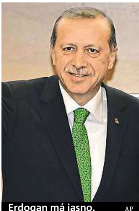
Erdogan má jasno.

Žádný Kryštof Kolumbus, Ameriku objevili muslimové, a to již ve 12. století. Tvrdí to turecký prezident.