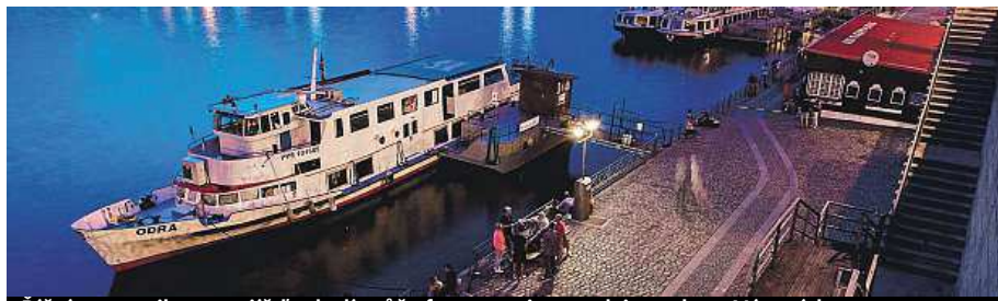
Říční romantika na vyjízdce lodí může fungovat i na podzim nebo o Vánocích.

„V zimním období jsou nejpopulárnější firemní akce a předvánoční plavby. Nabízíme pronájem obytných lodí bez průkazů či zkoušek s obsaditelností dvou až dvanácti osob. Lidé si tedy loď od délce sedm a půl až čtrnáct metrů sami řídí. K dalším službám