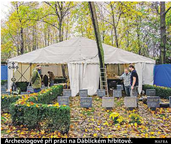
Archeologové při práci na Ďáblickém hřbitově.

Sdružení bývalých politických vězňů a další organizace nesouhlasí s okolnostmi vyzvednutí jeho ostatků a požadují vyzvednutí kostí všech politických vězňů minulého režimu, nikoliv pouze Toufara. Šachty hromadných hrobů na Ďáblickém hřbitově totiž skrývají tisíce obětí fašismu a komunismu, kromě Toufara by se zde měly nalézat i ostatky parašutistů, kteří zabili Reinharda Heydricha, nebo matky bratří Mašínů, ko-