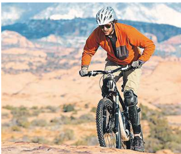
Na podzim už jezdí málokdo.

Pokud se domníváte, že vaše kolo servis nepotřebuje, alespoň ho po sezoně důkladně vyčistěte, promažte řetěz a uskladněte na vhodném místě. „Kolo by mělo být především v suchu. Pokud už ho musíte mít na balkoně, alespoň ho přikryjte, aby se tam k němu nedostala vlhkost,“ doplňuje Studnička.