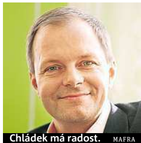
Chládek má radost.

V Česku se do šetření zapojilo 3200 žáků ze 170 škol, za