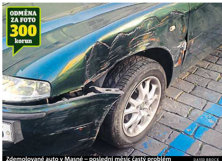
Zdemolované auto v Masné – poslední měsíc častý problém