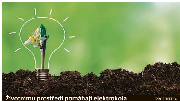
Životnímu prostředí pomáhají elektrokola.

Hodně lidí si čím dál více uvědomuje, že i drobné krůčky jednotlivců mohou pomoci zlepšit stav naší planety. Pochopily to i mnohé firmy, které k podobným krokům motivují své klienty a zákazníky. Programy tohoto typu, které lidem přinesou na oplátku také určitou odměnu, vnímá pozitivně podle loňského průzkumu společnosti Visa ve spolupráci s agenturou Ipsos až 70 procent Čechů. Jejich očekávání také často je, že se společnosti do sociální