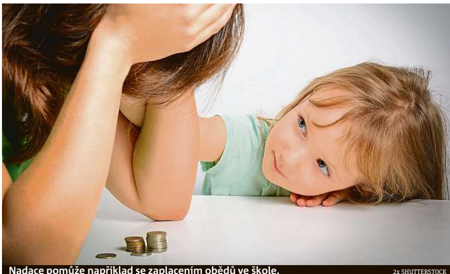
Nadace pomůže například se zaplacením obědů ve škole.

Jsou to oni, kdo se v současné době pomalu propadají