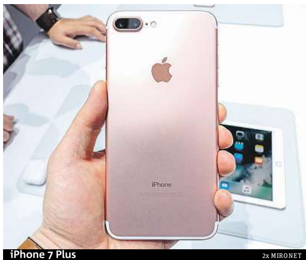
iPhone 7 Plus

lejší alternativu iPhone 7 – extrémně výkonný iPhone 7 Plus. Apple se velkým displejům svých telefonů dlouho bránil, poprvé se obrazovka větší než pět palců objevila až u minulé generace. Teprve vysoký zájem o tento model přiměl vedení společnosti změnit názor – „plusové“ varianty se tak stávají plnohodnotnou součástí každé nové série. iPhone 7 Plus disponuje 5,5“ Full HD Retina displejem s technologií 3D touch, schopnou rozeznat sílu přítla-ku. Na ohromujícím výkonu má zásluhu jeden z nejvýkonnějších čipů současnosti, A10 Fusion. Stejně jako iPhone 7 odolá i „plusko“ vodě a pra-