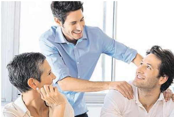
Pochvala před kolegy potěší, ale není moc častá.

Dobře odvedená práce se jeví jako samozřejmost. Pochvaly se tedy v tuzemsku jen tak nedočkáte.