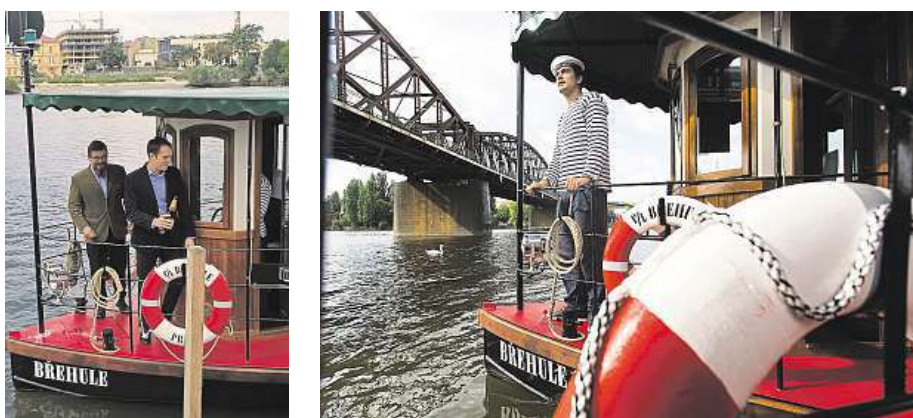
Náplavka byla včera svědkem představení a křtu tří nových převoznických lodí. 2x MAFRA a METRO