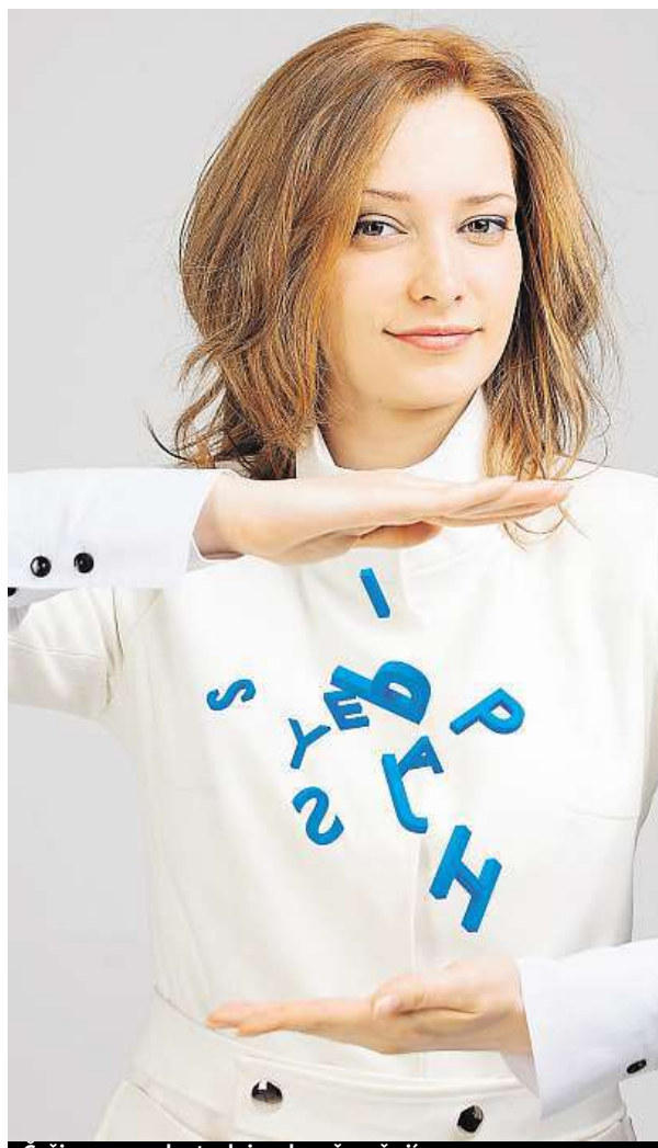
Češi se ve znalostech jazyka přeceňují.

Pokud uchazeč ve výběrovém řízení uspěje, může na zdokonalování znalosti cizího jazyka dál pracovat. Jazykové kurzy totiž patří k jednomu z nejčastěji nabízených benefitů v Česku. Pokud mají zaměstnanci možnost výběru, volí anglický jazyk. Tomu se v rámci poskytovaného benefitu věnuje 72 procent zaměstnanců, nejčastěji chtějí zapracovat na zlepšení mluveného projevu. O německý jazyk má zájem pouze 17 procent lidí. Německy hovořící zaměstnanci začínají být horším zbožím. „Největší poptávka je po kurzech obchodní angličtiny, kterou dnes v podnikání potřebuje téměř každý. Velký zájem je také o odborný jazyk v oblasti marketingu, účetnictví nebo stavebnictví,“ doplňuje lektorka angličtiny Miroslava Valigurová. PETR HOLEČEK