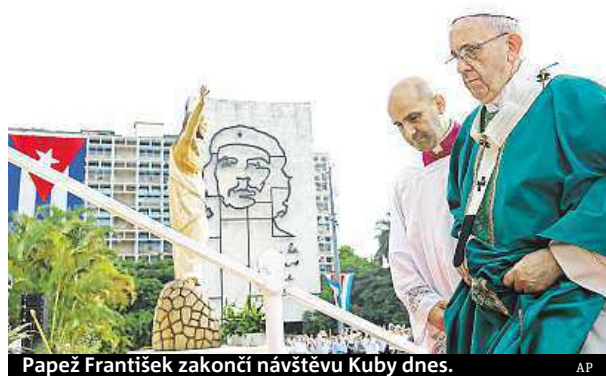
Papež František zakončí návštěvu Kuby dnes.

Papež František včera odsloužil svou první mši na Kubě.