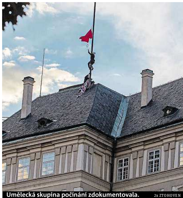
Umělecká skupina počínání zdokumentovala.