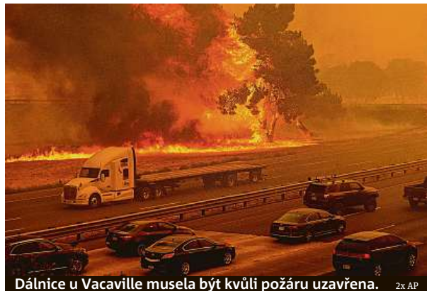
Dálnice u Vacaville musela být kvůli požáru uzavřena.