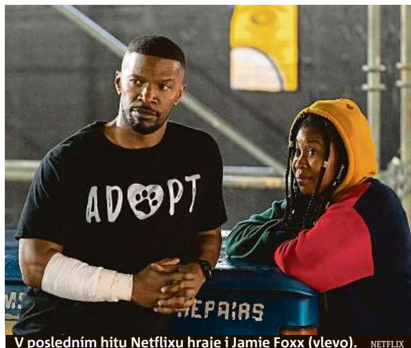
V posledním hitu Netflixu hraje i Jamie Foxx (vlevo).

„Problém také nastává ve chvíli, kdy tyto pořady dokoukají a měli by si sami najít něco nového ke sledování. Celých 58 procent uživatelů streamovacích služeb uvádí, že je nebaví procházet nabídku a vybírat z ní. Každá služba má rozsáhlé databáze