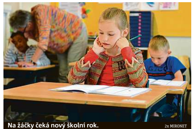
Na žáčky čeká nový školní rok.

Samozřejmě nechybí ani klasické vybavení, které je na tuto roční dobu potřeba. Při nákupu elektroniky tak do košíku budete moct rovnou přihodit i aktovku Step by Step TOUCH opěvovanou sportovním časopisem dTest. Má kvalitní polstrování vyhovující certifikaci AGR a lze ji zakoupit ve výhodném setu s penálem, pouzdem, peněženkou a pytlíkem na cvičební úbor nebo přezůvky za 3490 korun. Jedním nákupem tak vyřešíte vše potřebné.