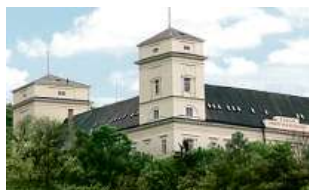
Zámek Račice, přestavba