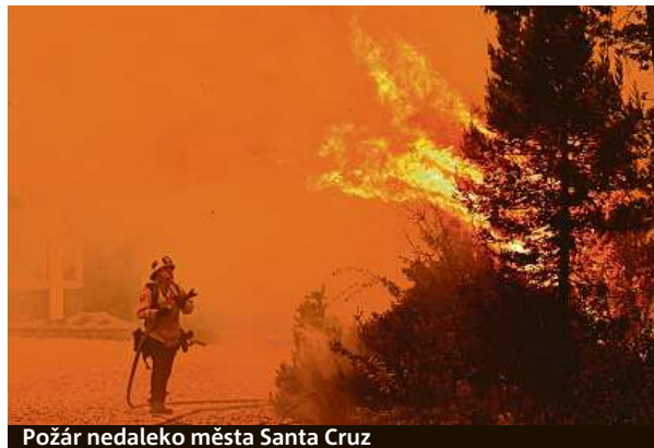
Požár nedaleko města Santa Cruz

Kalifornie počítá s dalším nárůstem počtu požárů.