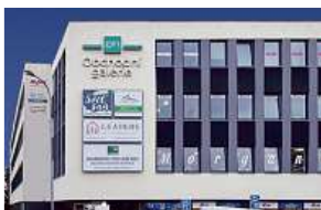
Obchodní galerie, Jihlava