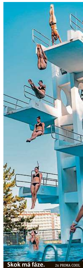
Skok má fáze. 2x PRIMA COOL

Otevření areálu pro návštěvníky je naplánováno na dvanáct hodin. Nejtalentovanější jumper si může za odměnu příští rok zaskákat na akci znovu.