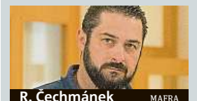
R. Čechmánek

Zlínský soud začal už potřetí projednávat případ bývalého úspěšného hokejového brankáře a zkrachovalého podnikatele Romana Čechmánka, jemuž hrozí až deset let vězení za podvod. Vrchní soud v Olomouci původní zprošťující rozsudky po odvolání žalobce pokazil. IDNES.cz