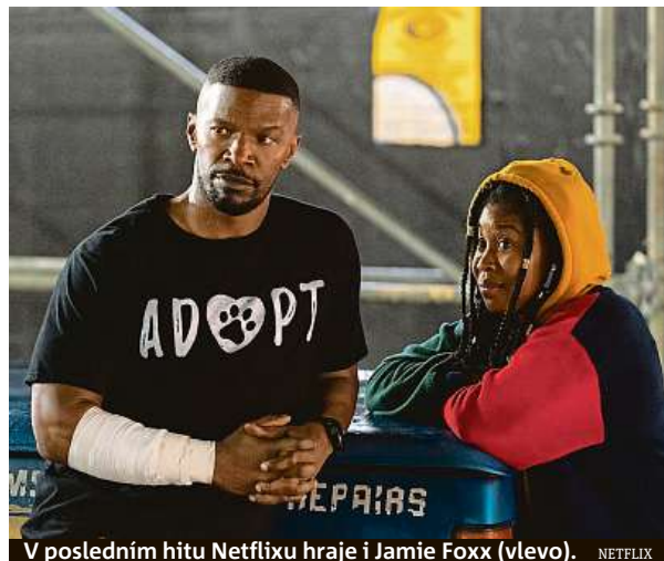
V posledním hitu Netflixu hraje i Jamie Foxx (vlevo).

„Problém také nastává ve chvíli, kdy tyto pořady dokoukají a měli by si sami najít něco nového ke sledování. Celých 58 procent uživatelů streamovacích služeb uvádí, že je nebví procházet nabídku a vybírat z ní. Každá služba má rozsáhlé databáze