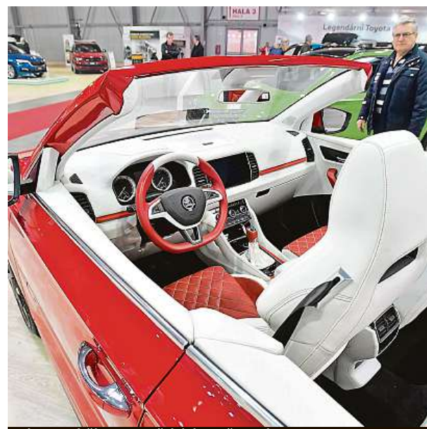
Akce proběhne v pražských Letňanech.

Na zkušební okruhu budou moci zájemci usednout za volant různých typů vozů a udělat si obraz i o svém budoucím automobilu.