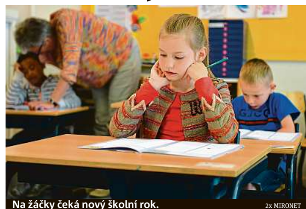
Na žáčky čeká nový školní rok.

Samozřejmě nechybí ani klasické vybavení, které je na tuto roční dobu potřeba. Při nákupu elektroniky tak do košíku budete moct rovnou přihodit i aktovku Step by Step TOUCH opěvovanou sportovním časopisem dTest. Má kvalitní polstrování vyhovující certifikaci AGR a lze ji zakoupit ve výhodném setu s penálem, pouzdem, peněženkou a pytlíkem na cvičební úbor nebo přezůvky za 3490 korun. Jedním nákupem tak vyřešíte vše potřebné.