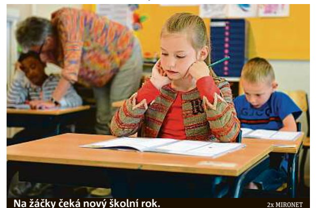
Na žáčky čeká nový školní rok.

Samozřejmě nechybí ani klasické vybavení, které je na tuto roční dobu potřeba. Při nákupu elektroniky tak do košíku budete moct rovnou přihodit i aktovku Step by Step TOUCH opěvovanou sportovním časopisem dTest. Má kvalitní polstrování vyhovující certifikaci AGR a lze ji zakoupit ve výhodném setu s penálem, pouzdem, peněženkou a pytlíkem na cvičební úbor nebo přezůvky za 3490 korun. Jedním nákupem tak vyřešíte vše potřebné.