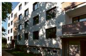
Bytový dům, Brno-Chrlice