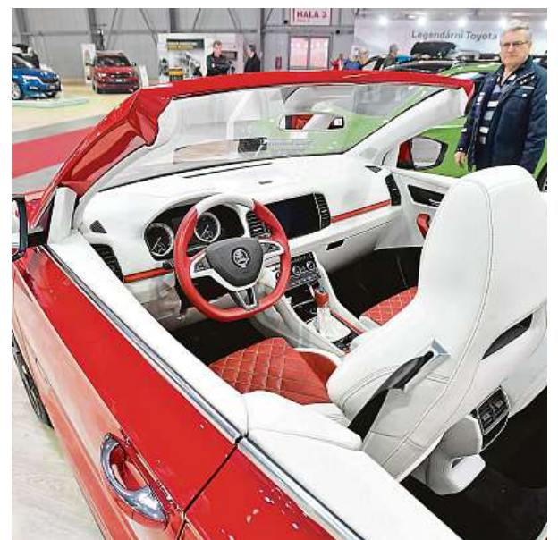
Akce proběhne v pražských Letňanech.

Na zkušební okruhu budou moci zájemci usednout za volant různých typů vozů a udělat si obraz i o svém budoucím automobilu.