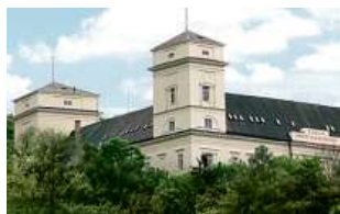
Zámek Račice, přestavba