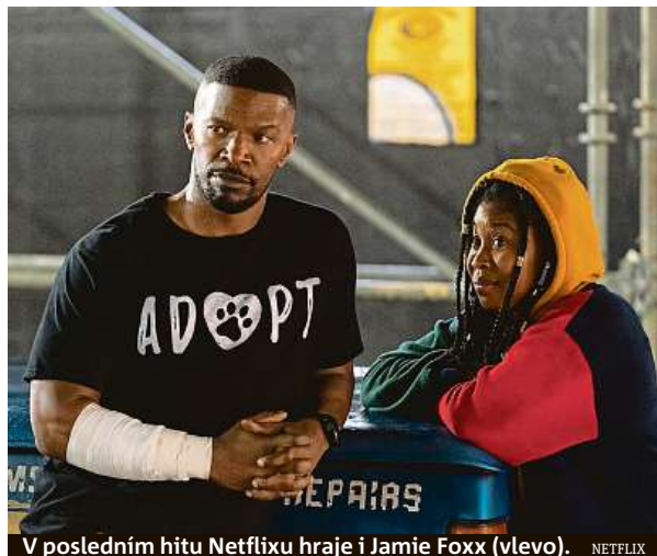
V posledním hitu Netflixu hraje i Jamie Foxx (vlevo).

„Problém také nastává ve chvíli, kdy tyto pořady dokoukají a měli by si sami najít něco nového ke sledování. Celých 58 procent uživatelů streamovacích služeb uvádí, že je nebaví procházet nabídkou a vybírat z ní. Každá služba má rozsáhlé databáze