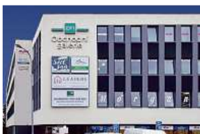
Obchodní galerie, Jihlava