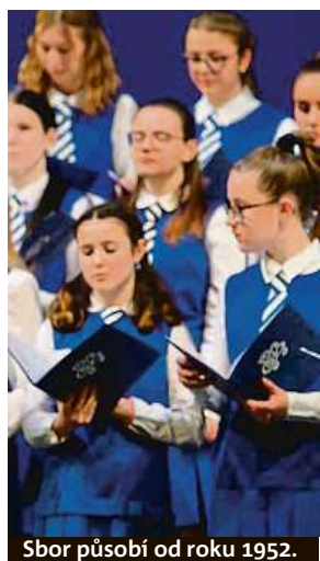
Sbor působí od roku 1952.