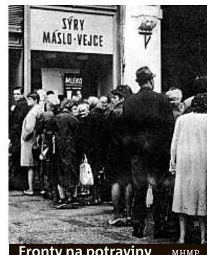
Fronty na potraviny MHP

Po budově běhali ozbrojenci jako zběsilí, snažili