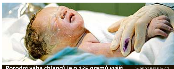
Porodní váha chlapců je o 135 gramů vyšší.

Průměrná hmotnost narozeného dítěte loni činila přesně 3283 gramů. „Nejčastěji se rodí děti vážící 3000 až 3499 gramů, které vloni tvořily skoro 39 procent všech živě narozených. Druhou nejčastější skupinou jsou děti vážící 3500 až 3999 gramů s 28procentním zastoupením,“ uvedl Roman Kurkin z oddělení demografické statistiky Českého statistického úřadu (ČSÚ). Loni přišlo na svět 505 dětí s extrémně nízkou váhou do jednoho kilogramu, před 11 lety jich bylo