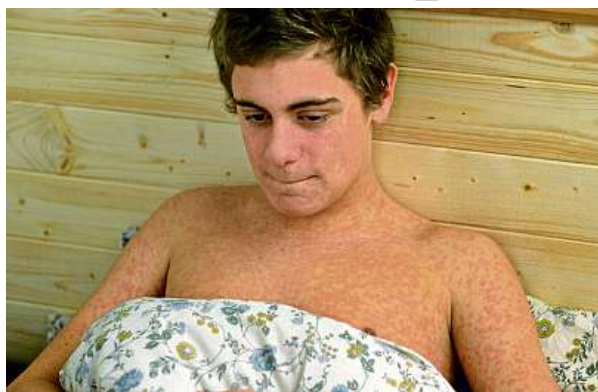
Komplikace nastávají až u třetiny případů spalniček.

„Spalničky jsou vysoce nakažlivé virové onemocnění, které se šíří kapenkami, vzduchem nebo přímým kontaktem s nemocným. Onemocnění se projeví asi 10 až 12 dní