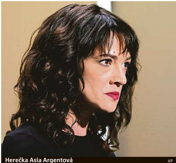
Herečka Asia Argentová

Bennett tvrdil, že Argentová na něj sexuálně zaútočila,