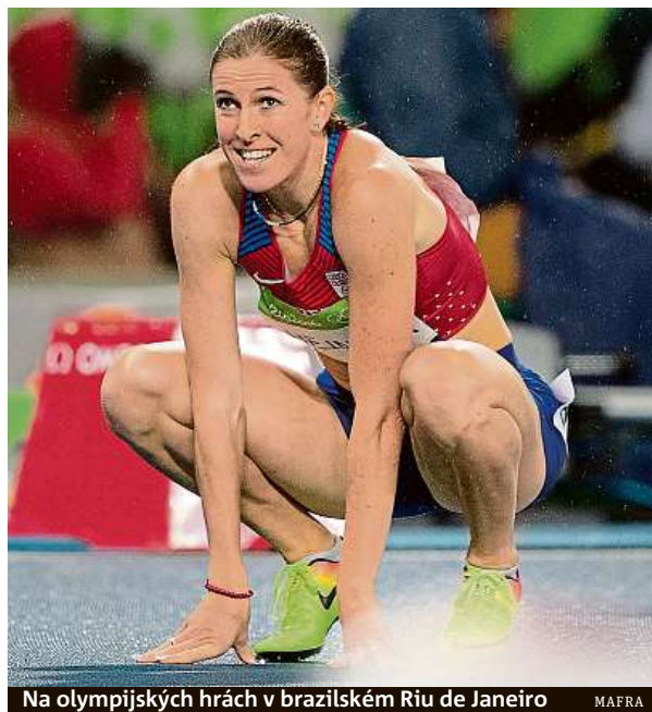
Na olympijských hrách v brazilském Riu de Janeiro MAFRA

S atletikou by ještě nerada končila. „Sport mě baví, ale potřebuju být zdravá. Teď si odpočinu fyzicky i psychicky a od nového roku jsem zpět,“ prohlásila. SIM a ČTK