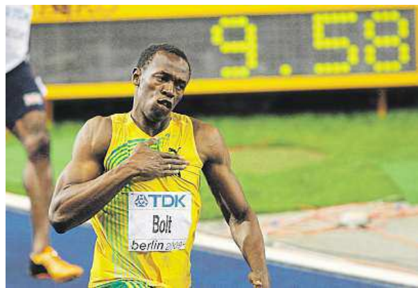
Na MS 2009 v Berlíně zaběhl Usain Bolt světový rekord.