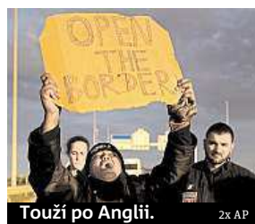
Touží po Anglii.

Francie se s Velkou Británií dohodla na zřízení společné jednotky se sídlem ve francouzském Calais, odkud míří