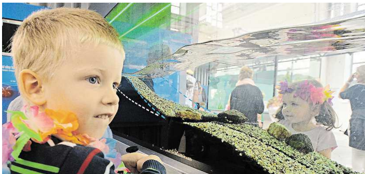
V plzeňském Techmania Science Centru byla včera slavnostně otevřena nová expozice Pod hladinou.

Žadonění. Dětská touha po věcech, které má kamarád, je přirozená. Náklady. Školáci si ale neuvědomují, kolik vysněná elektronika rodiče stojí. Pomoc. Jediné účinné řešení je bavit se s dítětem o prioritách STRANA 8