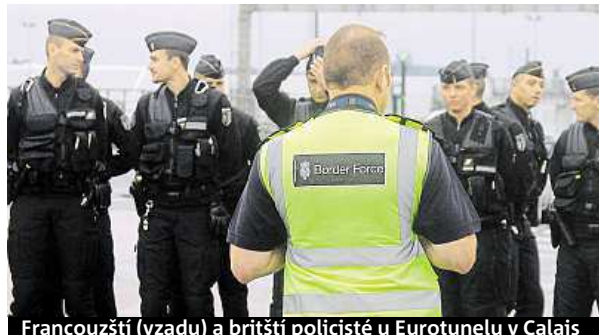
Francouzští (vzadu) a britští policisté u Eurotunelu v Calais

Poprvé budou na území Francie operovat britští policisté. Důvodem je uprchlická krize.