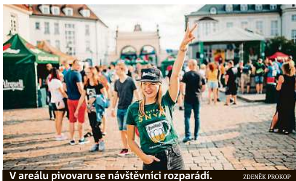
V areálu pivovaru se návštěvníci rozparádí.

Pubu a Anděl Music Baru. Jeden večer bude věnován pouze metalu v podání kapel Khargados, Second Breath a Nasty Ratz. Během devíti dnů vystoupí také Odyssea, Extra Band Revival, The Dozen Street, herec a písničkář Jiří Schmitzer nebo Buty. Program neochudí ani milovníky vážné hudby – Plzeňská filharmonie zahraje nejznámější filmové melodie. REI