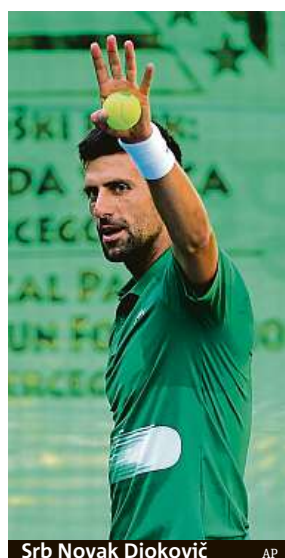
Srb Novak Djoković

Autoři petice na serveru change.org vyzývají Americkou tenisovou asociaci (USTA), aby zatlačila na americkou vládu: „V této fázi pandemie není naprosto žádný