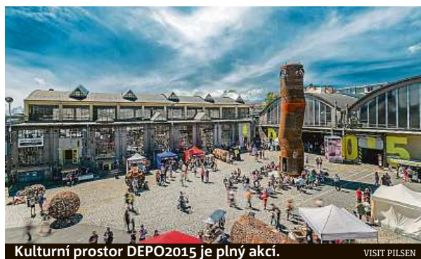
Kulturní prostor DEPO2015 je plný akcí. VISIT PILSEN