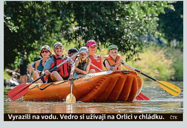
Vyrazili na vodu. Vedro si užívají na Orlici v chládku. ČTK

O odškodnění za výbuchy ve Vrbeticích na Zlínsku, kde v roce 2014 explodovaly municiční sklady, požádalo 9187 občanů. Ministerstvo vnitra zatím vyhovělo 8599 z nich, dosud vyplatilo dohromady přes 298 milionů korun. Česko za výbuch vinilo tajné ruské agenty. To vedlo k diplomatické roztržce. ČTK