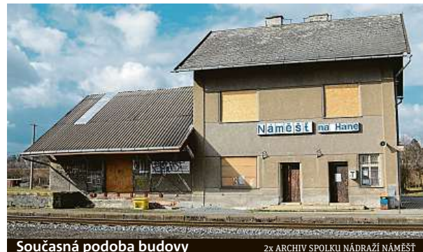
Současná podoba budovy

„Vždy jsem se zajímal o dění kolem sebe. Když jsem jel před pěti lety na návštěvu k příbuzným, všiml jsem si, že přístřešek už neexistuje, tak jsem začal pátrat,“ vypráví