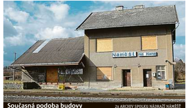
Současná podoba budovy

„Vždy jsem se zajímal o dění kolem sebe. Když jsem jel před pěti lety na návštěvu k příbuzným, všiml jsem si, že přístřešek už neexistuje, tak jsem začal pátrat,“ vypráví