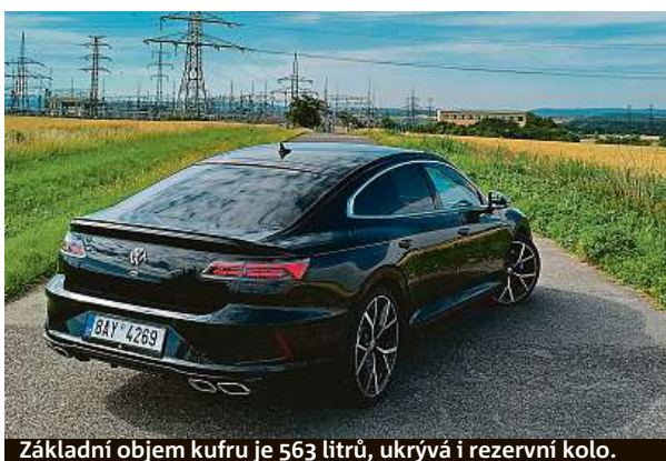
Základní objem kufru je 563 litrů, ukrývá i rezervní kolo.

šlápnutí plynu auto ochotně vystřelí, dobrou práci odvádí sedmistupňový dvouspojkový automat, který se naučil přenášet maximální točivý moment motoru už od prvního stupně. I turbo tu má jakousi zvláštnost – vracející se výfukové plyny jsou chlazené kapalinou, což pomáhá jeho výkonu. Důležité je ale to písmeno R. Auto je oproti klasickému Arteonu o 20 mm níže k zemi, ale hlavně – jeho pohon všech kol se pyšní systémem R-Performance Torque Vectoring. Ten je tvořený rozvodovkou zadní nápravy s vícecelamelovou mezinápravovou spojkou, která variabilně rozděluje hnací sílu nejen mezi přední a zadní nápravu, ale i mezi obě zadní kola. Může se tak stát, že se lehce sklouznete při výjezdu zatáčkou. Ale to už fakt musíte chtít. Jinak je Arteon R stabilní a přesný – to, jak rozhazuje sílu mezi kola, mimochodem závisí i na poloze volantu a pedálu plynu. Hezké auto s velkým kufrem, praktické, manažerské a k tomu sporták. To se Volkswagenu povedlo. PETR HOLEČEK