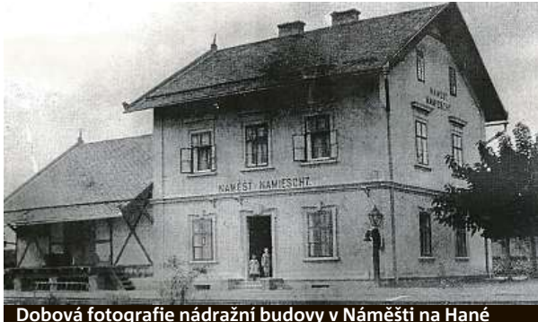
Dobová fotografie nádražní budovy v Náměšti na Hané

Historickou nádražní budovu v Náměšti na Hané prošly za 140 let její existence tisíce lidí. Dříve životem pulzující stavení plnilo funkci brány do městyse. Místní se pyšní třeba tím, že když Náměšť navštívil 16. června 1929 Tomáš Garrigue Masaryk, kolem nádraží projížděl.