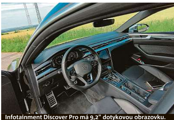
Infotainment Discover Pro má 9,2" dotykovou obrazovku.

Přeplňovaný dvoulitrový čtyřválec s přímým vstříkovaním benzínu má neskutečnou chuť jít vpřed. Při se-