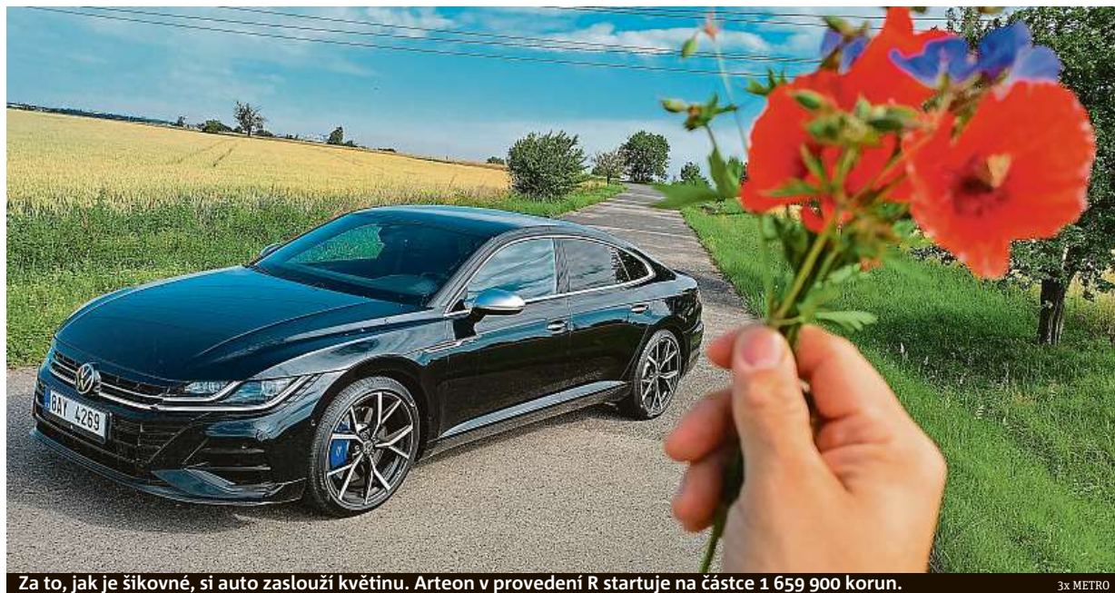
Za to, jak je šikovné, si auto zaslouží květinu. Arteon v provedení R startuje na částce 1 659 900 korun.