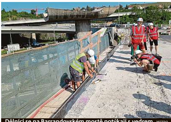
Dělníci se na Barrandovském mostě potýkají s vedrem.

Oproti původním předpokladům totiž dělníci na mostě kvůli vyšší původní vrstvě asfaltu používají speciální „chytřejší“ beton s takzvanou rozptýlenou výztuží. Tato technologie zdraží rekonstrukci o řádově desítky milionů korun. „Chceme most opravit co nejlépe a využít všechny moderní technologie, které nabízí 21. století.