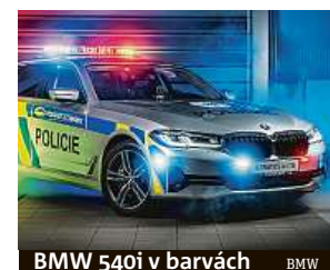
BMW 540i v barvách BMW

Prvních deset BMW 540i xDrive Touring ve speciálním provedení pro dálniční hlídky převzali zástupci policie. Z celkem 70 aut, na něž má policie uzavřenou rámcovou smlouvu, jich 40 bude v uniformě a 30 anonymních. Na rozdíl od škodovek, které v „utajeném“ provedení pro službu u policie mají blikačky za okny viditelné díky výřezům v zatemňovací fólii, budou policejní BMW hůře odhalitelná. Auta bez policejního stejnozkroje nemají ani prutovou anténu na střeše. Zůstala jen u bavoráků v barvách policie s majákem na střeše. IDNES.cz