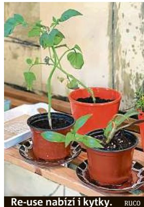
Re-use nabízí i kytky. RUCO

Pravidla jsou jednoduchá. Kdokoli může přinést nepotřebnou věc. Pokud si chcete něco odnést, zaplatíte do pokladničky podle vyvěšeného ceníku. Drobné a lehce poškozené předměty jsou za deset