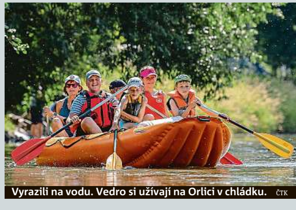
Vyrazili na vodu. Vedro si užívají na Orlici v chládku. ČTK

O odškodnění za výbuchy ve Vrbeticích na Zlínsku, kde v roce 2014 explodovaly municiční sklady, požádalo 9187 občanů. Ministerstvo vnitra zatím vyhovělo 8599 z nich, dosud vyplatilo dohromady přes 298 milionů korun. Česko za výbuch vinilo tajné ruské agenty. To vedlo k diplomatické roztržce. ČTK