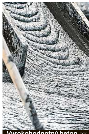
Vysokohodnotný beton TSK

„V tuto chvíli dochází k výměně mostních ložisek a zároveň probíhá betonáž deviatorů přímo v komoře nosné konstrukce. Dále se provrtávají příčníky pro vedení nových tras předpínacích kabelů,“ popisuje pro Metro mluvčí TSK Barbora Lišková. Práce