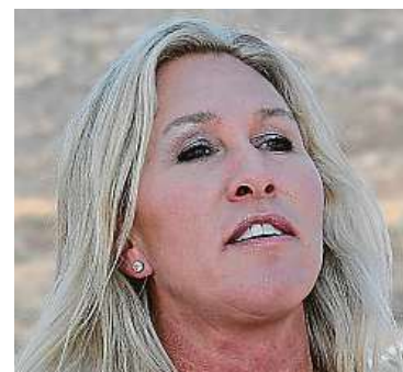
Marjorie Taylorová Greeneová

Společnost Twitter zablokovala účet kongresmance Marjorii Taylorové Greeneové.