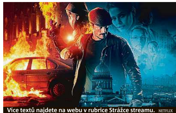
Více textů najdete na webu v rubrice Strážce streamu. NETFLIX

Abychom mohli chválit, řekněme si nejprve to negativní. Film Major Grom: Morový doktor se sice v klidu může měřit i s částí produkce ze zámoří, zda dosahuje kvalit komiksových počínů z USA, je však minimálně diskutabilní. Jde spíš o klasickou netflixovskou jednohubku, která si nedělá příliš hlavu ve složitým příběhem, a místo zajímavých postav a smysluplného příběhu nám tvůrci servírují oddechovku plnou nepřítis originalních zvrátů a, díky bohu, akce.