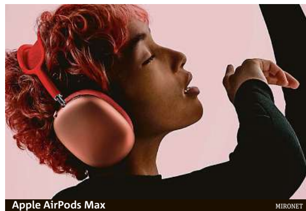
Apple AirPods Max