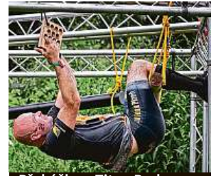
Překážka v Titan Parku WMC

Areál bude v sobotu otevřen v 10.30 a program bude probíhat až do půlnoci. Více informací najdou zájemci na www.praguelouka.cz . MET