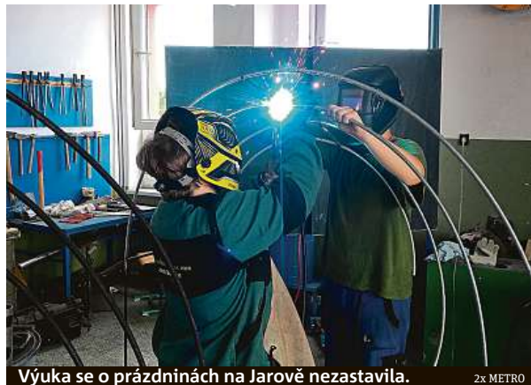
Výuka se o prázdninách na Jarově nezastavila.