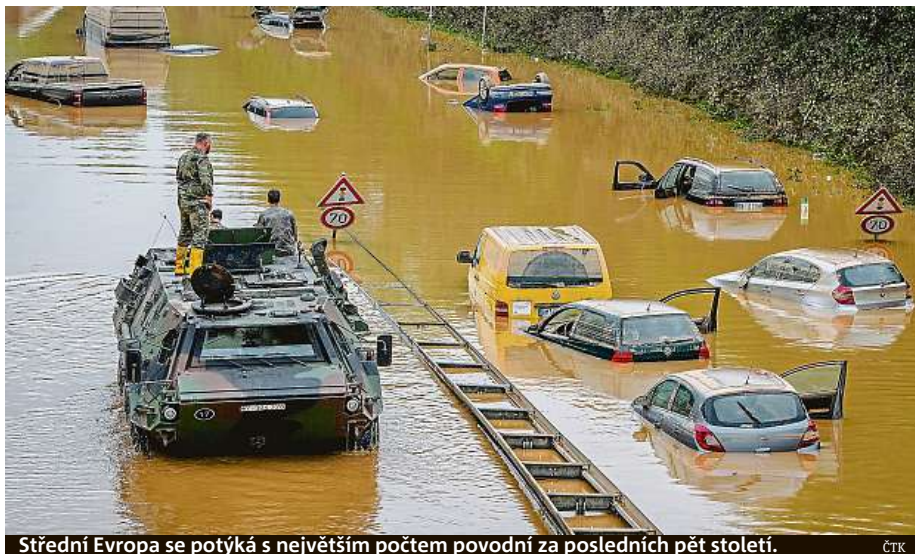
Střední Evropa se potýká s největším počtem povodní za posledních pět století.

Klimatické modely vznikají ve velkých světových a evropských centrech, my vybíráme ty nejkvalitnější, jelikož ne všechny dokážou dobře reprezentovat klima střední Evropy. Nově se v rámci projektu Technologické agentury České republiky Perun tvoří speciálně klimatický model ALADIN pro Česko, na kterém se podílí více vědeckých institucí zastoupených u nás a měl by vhodně doplnit současně používané modely ze světových center. Zatím se to, co modely předpokládají do budoucna, v posledních letech celkem dost potvrzuje. To je růst teploty vzduchu, který pozorujeme od osmdesátých let a v posledním desetiletí nabral rychlejší tempo. Také modely samotné počítají s velkou variabilitou srážek, s tendencí k suchu se střídáním přívalovými srážkami. To vše jsme v posledních dekádách zažili. Proto předpokládáme, že modely jsou spolehlivé, ale zjišťujeme u nich spíše jiný problém. Pokud jsme porovnali jejich výstupy pro poslední dekádu, tak tyto modely celkem dost podcenily současný stav – a takové oteplení předpokládaly až pro období po roce 2040. To znamená, že jedeme momentálně po horší trajektorii, než mají samotné modely. Doufáme ale, že poslední dekáda byla jen exces a oteplení nebude pokračovat v takovém tempu, protože to by znamenalo dost velkým problémem. PAVEL HRABICA