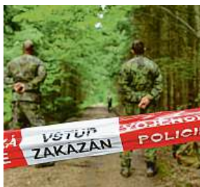
Policie okolí výbuchu ještě více uzavřela.