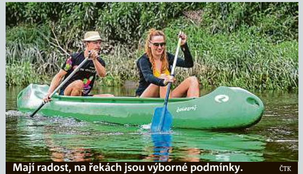
Mají radost, na řekách jsou výborné podmínky.