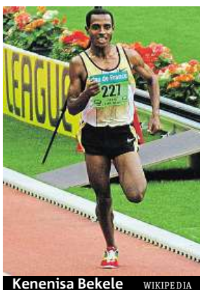
Kenenisa Bekele

Trojnásobný olympijský šampion Kenenisa Bekele je velmi zklamaný, že se nedostal do nominace na OH v Riu. Čtyřiařicetiletý etiopský vytrvalec za viníky označil funkcionáře národního atletického svazu, kteří podle něj vůbec sportu nerozumějí. Bekele usiloval o start v maratonu, ale nesplnil nominační kritéria. A nevyšel mu ani pokus na 10kilometrové trati. „Svaz nastavil taková nominační kritéria, o kterých věděl, že je nemohu splnit. Oni o atletice nevědí vůbec nic,“ řekl Bekele. ČTK