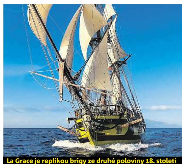
La Grace je replikou brigy ze druhé poloviny 18. století

Historická plachetnice la Grace hledá na týden posádku. Je to hlavně zážitek.