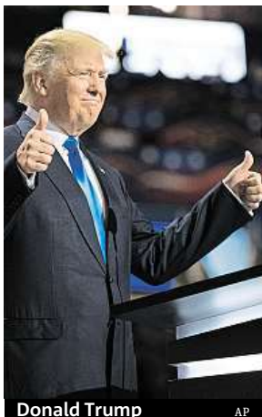
Donald Trump

„Je pro mě velkou ctí být republikánským kandidátem