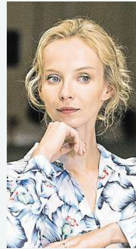
Ztraceni v Mnichově

Velká přehlídka nových českých hraných a dokumentárních filmů v pražském kině Dlabáčov startuje pod názvem České filmové léto 8. srpna. Až do konce prázdnin je na ní možné zhlédnout více než třicet českých hraných filmů a dokumentů, které vznikly během uplynulých dvanácti měsíců. Diváci se mohou těšit například na hity jako Ztraceni v Mnichově (viz foto), Rodinný film či Já, Olga Hepnarová a dokumenty Lucie, příběh jedné kapele či Zkáza krásou. MET