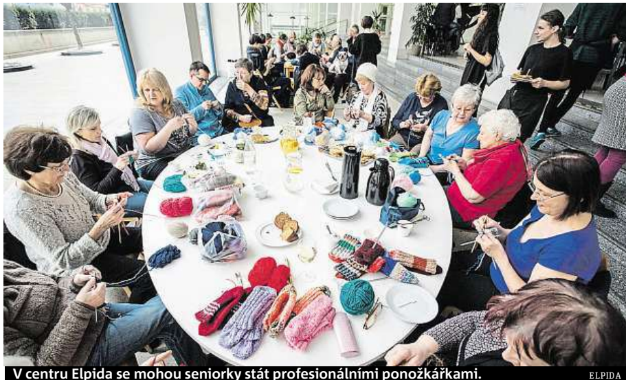
V centru Elpida se mohou seniorky stát profesionálními ponožkářkami.