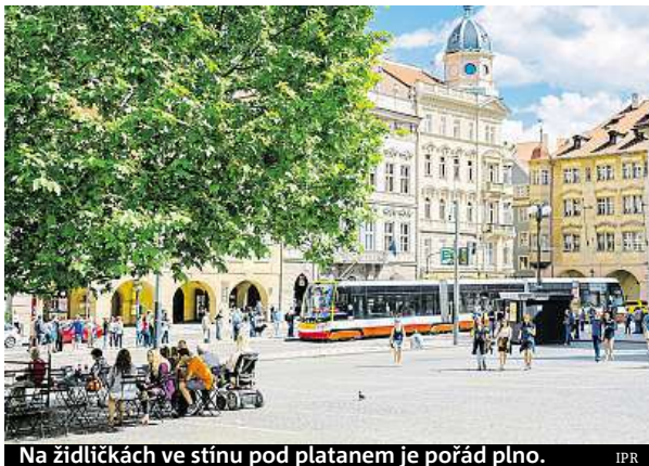
Na židličkách ve stínu pod platanem je pořád plno.