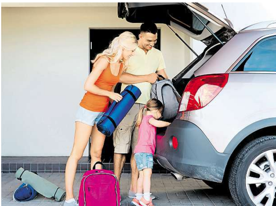
Těžší věci nakládáme do dolní části zavazadlového prostoru, nejlépe na dno.

„Zásadou je, že těžší věci nakládáme jako první do dolní části zavazadlového prostoru, nejlépe na dno. Menší tašky, popřípadě igelitové pytlíky pak mohou vyplnit malé skulinu, které se kolem velkých zavazadel vytvoří. Čím lehčí věci, tím je dáváme více nahoru. Některá menší zava-