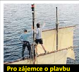
Pro zájemce o plavbu

devším obratnosti,“ zdůrazňuje. Zajímavé momenty se dějí i na palubě. V případě silného větru, kdy loď pluje pod plnými plachtami a najednou je třeba udělat obrát, musí spolupracovat celá po-