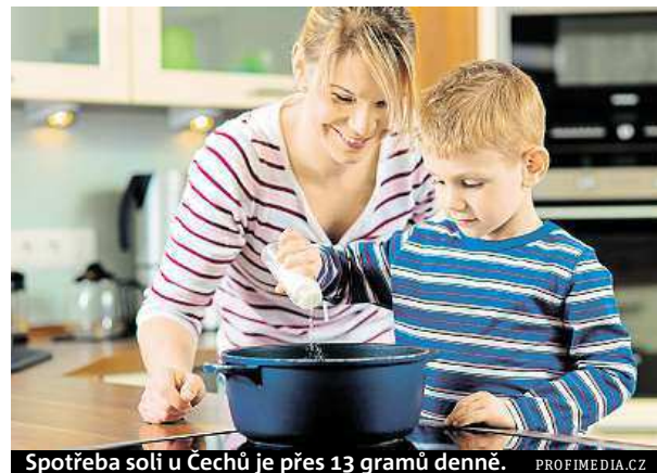
Spotřeba soli u Čechů je přes 13 gramů denně.

„Hodně slané potraviny – chipsy, fast food, uzeniny, sýry – bývají celkově chuťově