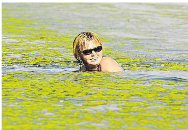
Sinice mohou poškodit nejen oči.

Horké letní dny přímo vybízejí k natáhnutí plavek a ke skočení do chladivých vln řek, rybníků či jiných vodních nádrží. Ale před takovým skokem je více než vhodné se alespoň trochu zamyslet. A to nejen nad teplotou či hloubkou koupaliště. Velké problémy totiž může způsobit i kvalita vody a přítomnost nežádoucích mikroorganismů, jako jsou sinice.