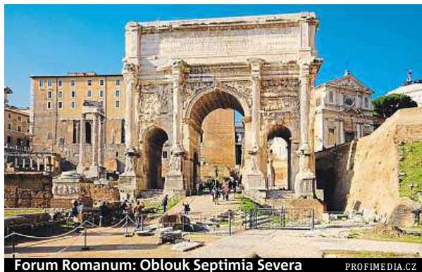
Forum Romanum: Oblouk Septimia Severa

Celkový rozpočet činí čtyři miliony eur (téměř 110 milionů korun). První milion eur na úvodní fázi archeologických vykopávek na římském Foru Romanum dostane město od Ázerbájdžánu, který zde