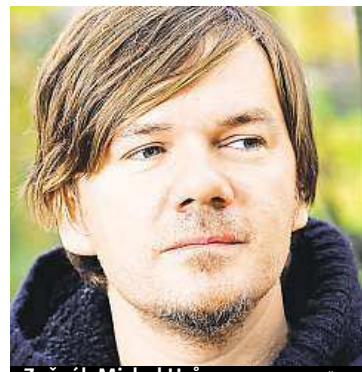
Zpěvák Michal Hrůza

Okresní soud v Ostravě poslal do vazby oba mladíky, kteří jsou podezřelí ze čtvrtletního napadení zpěváka a skladatele Michala Hrůzy. Policie muže ve věku 18 a 19 let obvinila z vydírání, ublížení na zdraví a výtržnictví. Uvalení vazby soudkyně vysvětluje obavou, že by se oba obvinění, kterým hrozí až 12 let vězení, mohli vyhýbat trestnímu stíhání, popřípadě ovlivňovat ještě nevyšlechnuté svědky. Hrůza se pokusil od sebe oddělit dva mladíky, kteří se ve Stodolní ulici prali. Když se mu to nepodařilo, chtěl zavolat policii. V tu chvíli se oba obrátili proti němu a zbili jej. ČTK