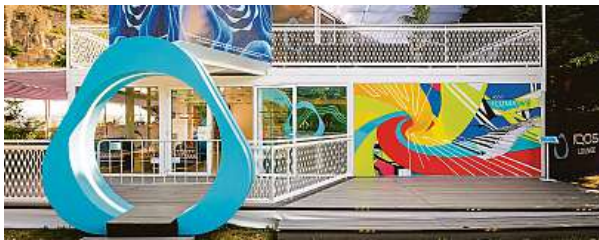
IQOS LOUNGE u hotelu Thermal