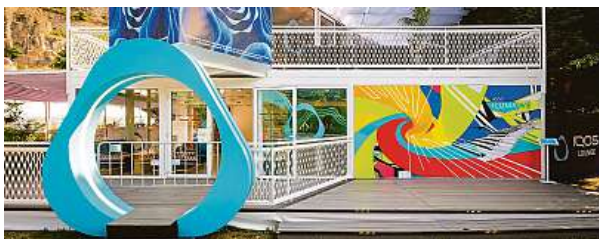
IQOS LOUNGE u hotelu Thermal