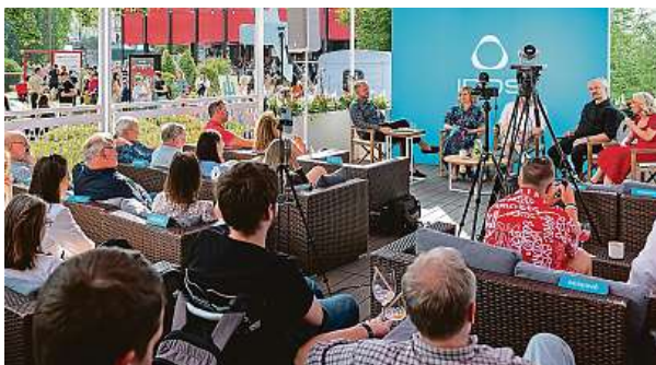
Talk show v IQOS Lounge

Najděte svůj důvod, proč letos navštívit IQOS LOUNGE a laboratoř Svět bez kouře na 58. Mezinárodním filmovém festivalu v Karlových Varech.