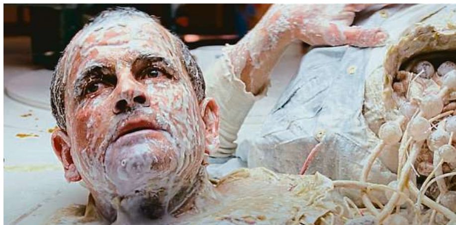
Zrádná postava androida Ashe nastoluje nadčasové otázky. Aktuálně na téma umělé inteligence.