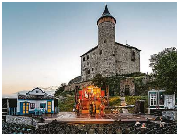
Dnes se pod širým nebem chystá premiéra pohádky Boženy Němcové, která se proslavila především ve filmové podobě.

„Máchale, spadlo ti to!“ zazní pod Kunětickou horou.