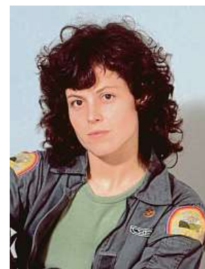
Sigourney Weaverová bude navždy hlavně Ellen Ripleyovou.

Původně měly postavu vetřelce představit na dálku ovlá-