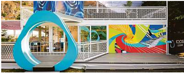
IQOS LOUNGE u hotelu Thermal

Již tradičně bude po celou dobu konání 58. ročníku MFF Karlovy Vary (28. 6. až 6. 7.) dospělým návštěvníkům k dispozici unikátní IQOS LOUNGE. Prostor, který bude opět umístěn u hotelu Thermal, nabídne široké spektrum zábavy. Dospělí návštěvníci se mohou potkat se zajímavými umělci a osobnostmi nejen během talk show a koncertů, ale i při jednotlivých speciálních setkáních. K dispozici bude i nová prostornější terasa, kde si můžete užít festivalovou pohodu s koktejlem v ruce a prozkoumat svět bezdýmných alternativ.