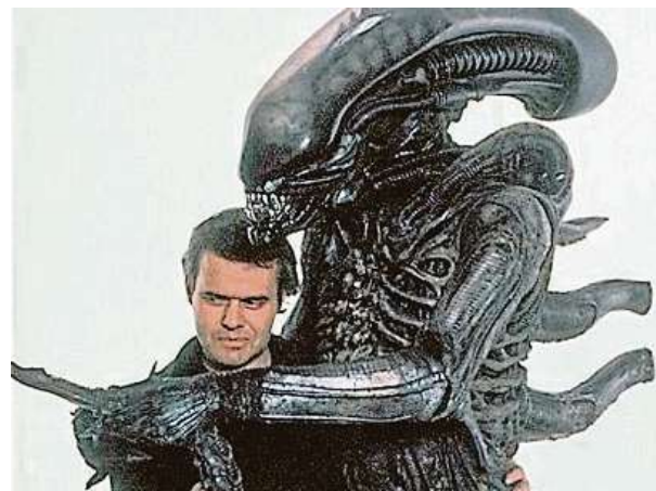
Designérem vetřelce a celé výtvarné stránky filmu byl Hans R. Giger.