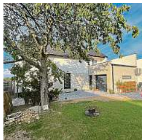
Vnitřní instalace i vnější omítky. Vše musí být perfektní.

Dřevostavby jsou dnes moderním trendem. Dřevo je ekologický materiál a stavby z něj dýchají příjemnou atmosférou. Dobře izolované budovy jsou i energeticky úsporné, a je-li dřevo správně ošetřeno, mají i dlouhou životnost. Domy postavené z cihel