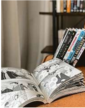
Je libo něco ke čtení?

Jedná se o pohlcující čtení, které se odehrává ve stejném světě jako již v úvodníku zmíněný populární Brutal. Dokonce je pod ním podepsaný stejný autor. Kei Koga se tentokrát navíc postaral nejen o scénář, ale i kresbu. Podobně jako u již jmenované série se jedná o drsnou krimi, jejíž protagonista se pohybuje tak trochu v morální šedé