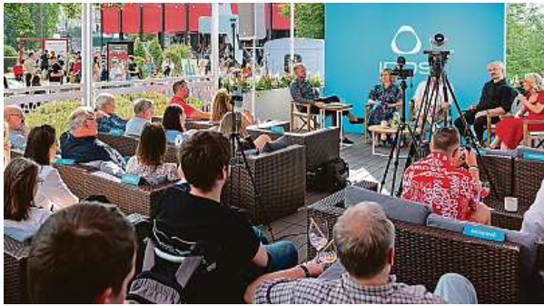
Talk show v IQOS Lounge

Najděte svůj důvod, proč letos navštívit IQOS LOUNGE a laboratoř Svět bez kouře na 58. Mezinárodním filmovém festivalu v Karlových Varech.