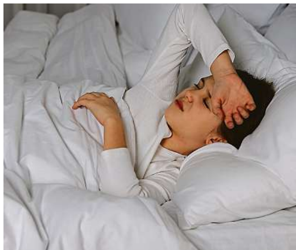
Migréna není jen bolest hlavy, její projevy jsou závažnější.

To, že ostatní nerozumí, co ataky migrény obnáší, a bolest zlehčují, pak zpětně vede k většímu stresu pacien-