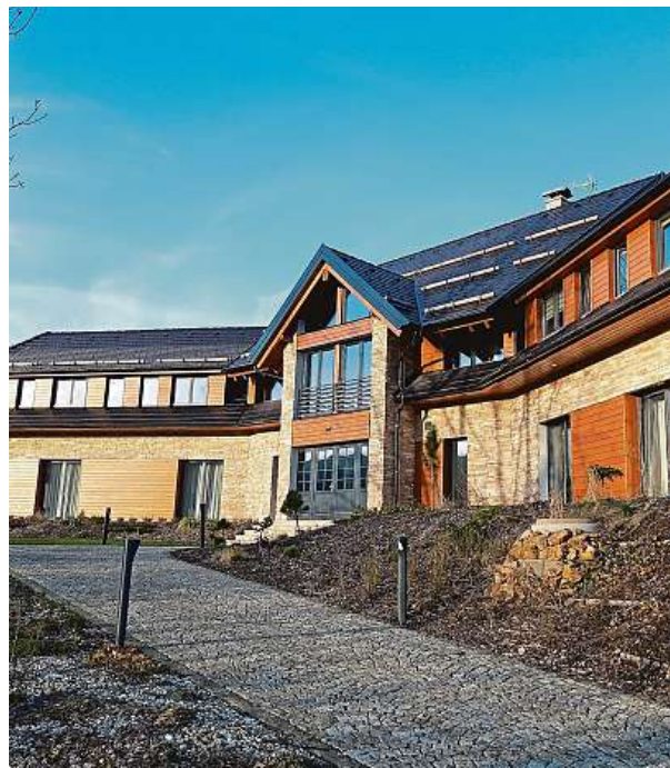
Novostavba domu na Šumavě

Vyplatí se přemýšlet ale třeba i nad vhodnou barvou fasády nebo nad tím, na kterou