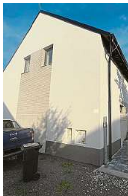
Dokončovací práce rodinného domu

Správnou volbu právě pro vás je dobré konzultovat s odborníky a teprve pak se rozhodnout. Rádi vám pomohou například ve společnosti WH STAWO Přeštice s.r.o.