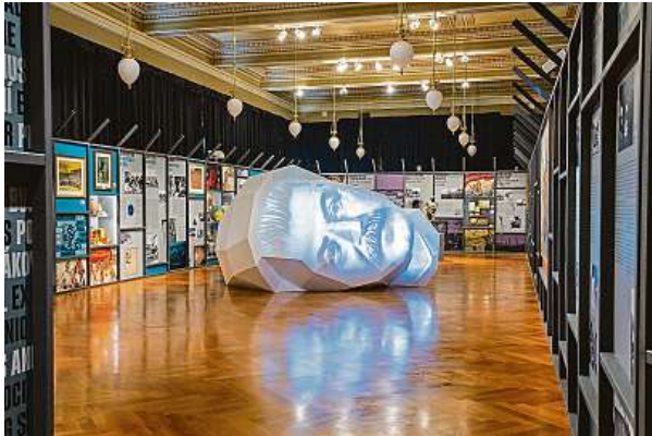
Josif Vissarionovič Stalin byl v letech 1922–1952 generálním tajemníkem Komunistické strany Sovětského svazu.

Výstava Padesátá léta představí návštěvníkům, období, kdy totalitní režim zasáhl do všech oblastí společenské struktury Československa, včetně ekonomiky, kultury, politiky či zahraničního ukotvení země. V muzeu je prezentován širší kontext 50. let, kdy se ústředním bodem stá-