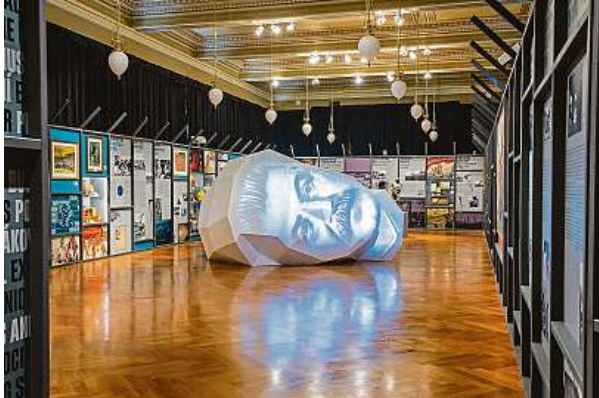
Josif Vissarionovič Stalin byl v letech 1922–1952 generálním tajemníkem Komunistické strany Sovětského svazu.

Výstava Padesátá léta představí návštěvníkům, období, kdy totalitní režim zasáhl do všech oblastí společenské struktury Československa, včetně ekonomiky, kultury, politiky či zahraničního ukotvení země. V muzeu je prezentován širší kontext 50. let, kdy se ústředním bodem stá-