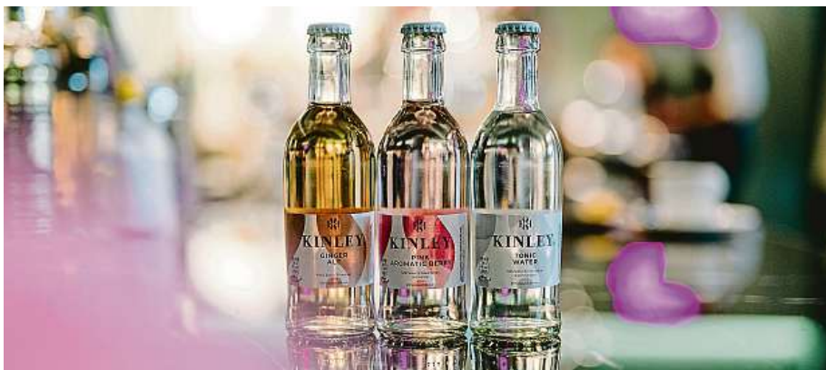
Udělejte si chvíli pro sebe a vyzkustejte nové příchutě Kinley.

Běžný pracovní den končí pro většinu městských obyvatel Česka a Slovenska nejpozději okolo 17. hodiny. Chvilku pro sebe si ve všední dny dokáže přesto pravidelně dopřát jen 31 procent Čechů a 24 procent Slováků. Často jsou na vině přesčasy, se kte-