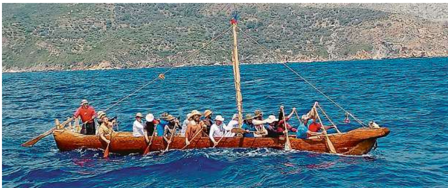
Experimentální archeologové z Archeoparku Věstary na Královéhradecku vyrazili po Egejském moři. Plavidlo vydlabané z jednoho kusu kmene vyplulo z ostrova Samos u pobřeží Turecka.

Výprava českých archeologů by měla přispět k poznání o šíření raných zemědělských kultur ve Středomoří. Navazuje na námořní výpravy hradeckých archeologů ve vydlabaných člunech z let 1995, 1998 a 2019, z nichž dvě byly v Egejském moři. Téměř tři tuny vážící člun je