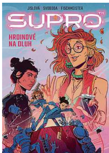
Knihu vydalo komiksově nakladatelství Crew. Má 160 stran. CREW

Zrovna jednu takovou komiksovou knížku dodělávám. Pod názvem Srdcovka vyjde v září v nakladatelství Paseka a zabírá se vším možným, od devadesátkového vyrůstání na sídlišti přes genderové role až po psychologické teorie o tom, proč nás to táhne k určitým typům partnerů. Je to tragicko-komediální kniha o milost-