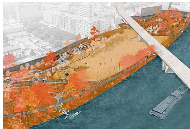
Dokončení parku je plánováno na první pololetí roku 2024.

„Místo parku je specifické, jelikož se jedná o aktivní zónu záplavového území a není zde možné umístit žádné stavby trvalého charakteru. Proto jsou naplánovány především krajinářské úpravy. Počítá se se zachováním vegetace, kterou doplní výsadba připomínající ovocné sady. Dominantou prostoru bude otevřená travnatá plocha pro pikniky či sportovní využití,“ doplnil Jiří Knitl, radní Prahy 7 pro veřejný prostor a životní prostředí. MET