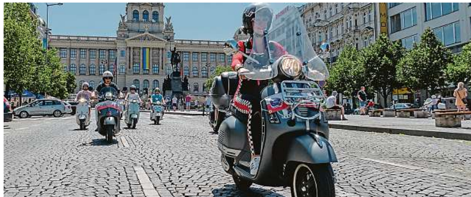
Zastávka skútrů Vespa na Václavském náměstí je vždy divácky velmi lákavá.

V sobotu po vydatné snídani bude následovat zlatý hřeb celého víkendů. V 10.30 všichni nasednou na své „stroje“ a společně projedou ta nejzajímavější pražská zákoutí. Po návratu do kempu bude na všechny čekat nabitě odpoledne, včetně výborného jídla, tomboly a koncertů.