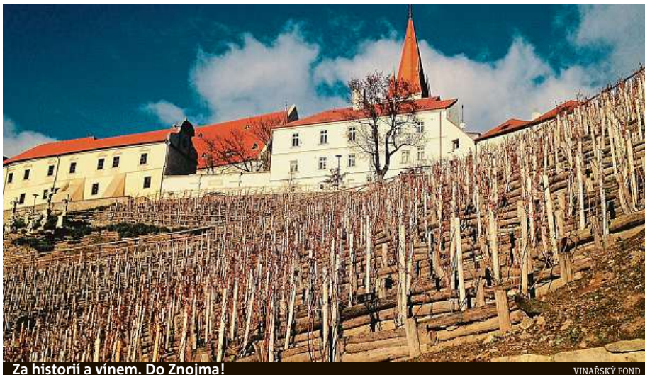
Za historií a vínem. Do Znojma!

Na Znojensku nemusíte hledat dlouho. V hlavním městě této oblasti, Znojmě, stojí hrad přestavěný na zámek. Znojmo je historické a vinařské město, takže taková stavba není žádným velkým překvapením a možnost dát si poblíž dobré víno je samozřejmostí. Hned po několika desítkách metrů, ještě v hradním komplexu, se nachází Enotéka znojenských vín. Ve vstupním prostoru je designová kavárna a vinárna, za nimi prostory, kde je mož-