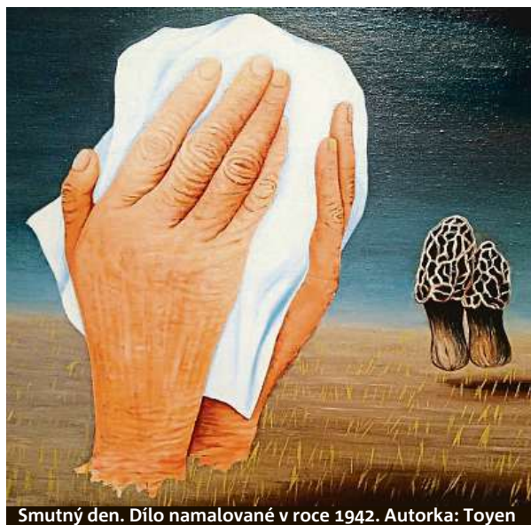
Smutný den. Dílo namalované v roce 1942. Autorka: Toyen