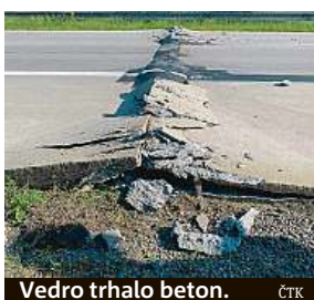
Vedro trhalo beton.

má podle něj všechna taková místa pod dohledem. Preventivně firma prošla celý úsek, který je tvořen 22 let starým