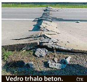
Vedro trhalo beton.

má podle něj všechna taková místa pod dohledem. Preventivně firma prošla celý úsek, který je tvořen 22 let starým