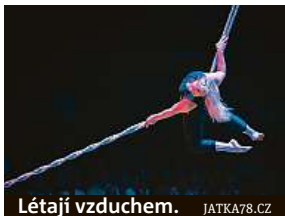
Létají vzduchem. JATKA78.CZ

Když se sejdou přátelé a slavi, svět se zdá rázem krásnější. Již ve čtvrtek diváci Azylu78 zjistí, jak taková oslava vypadá, jsou-li vašimi přáteli vrcholoví akrobaté.