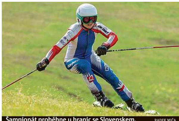
Šampionát proběhne u hranic se Slovenskem.