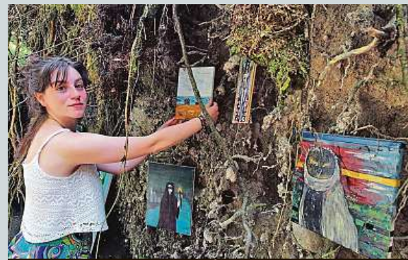
V galerii v nejdeckém lese může vystavovat každý.