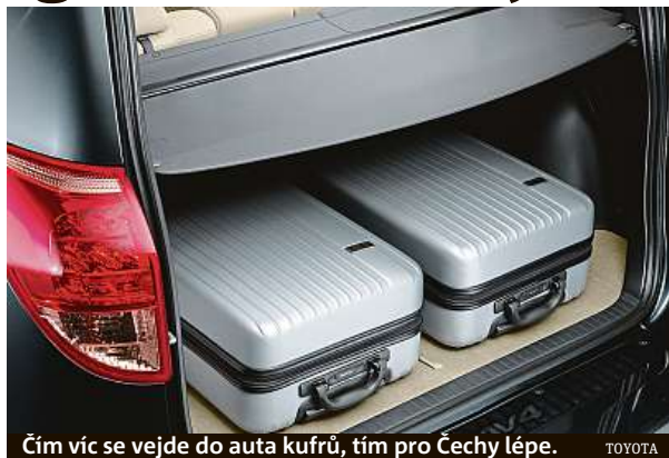
Čím víc se vejde do auta kufrů, tím pro Čechy lépe.