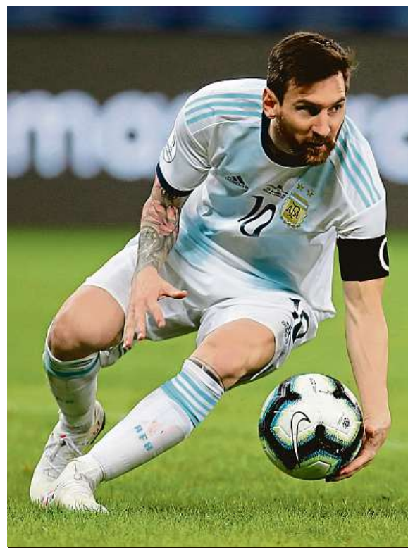
Argentinec Lionel Messi v utkání proti Paraguayi

Paraguay, která na úvod Copy América remizovala s Katar 2:2, poslal do vedení v 37. minutě Richard Sánchez. Po průniku Miguela Almiróna po levém křídle a jeho přihrávce k penaltovému puntíku se trefil přesně k levé tyči. Argentinci vyrovnali po poločasové přestávce z penalty nařízené za ruku Ivána Pirise, které se sice nikdo na hřišti nedožadoval, ale sudí ji nařídil na základě videa. O pět minut později kopal penaltu i soupeř po faulu Nicoláse Ota-