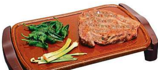
Pochoutky připravené na terakotě

Krásné počasí, rozkvetlé zahrádky a prázdný žaludek. To vše dohromady vybízí v těchto slunečných dnech mnoho lidí ke grilování. Co když ale z různých důvodů nechcete používat klasický gril na uhlí? Jde to i jinak. Masivní boom v posledních týdnech zažily terakotové grily. Terakota je druh jílu, z kterého se vyrábí speciální velmi odolná keramika, jež se již po celá staletí používá k vaření. Skvěle totiž odolává teplotu a zároveň dává připravovaným pokrmům jedinečnou chuť. I tyto vlastnosti vedly firmu Jata k tomu, že z terakoty vyrábí desky svých elektrických grilů.