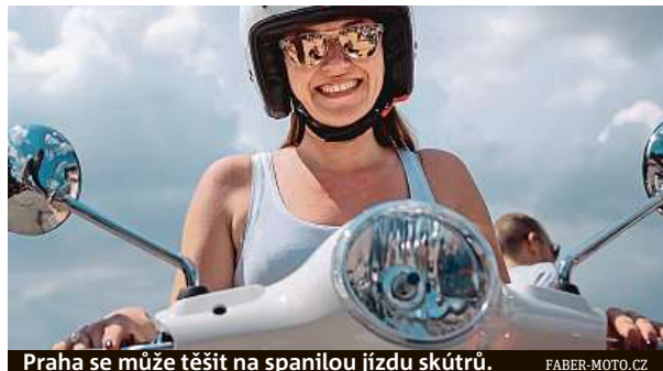
Praha se může těšit na spanilou jízdu skútrů. FABER-MOTO.CZ