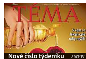
Nové číslo týdeníku ARCHIV