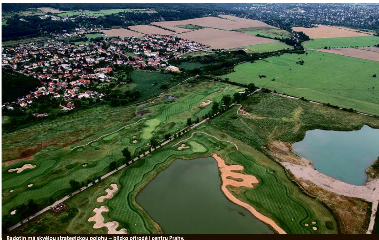
Radotín má skvělou strategickou polohu – blízko přírodě i centru Prahy.

Velké zlepšení je vidět i v ochraně životního prostředí. Co pomohlo?