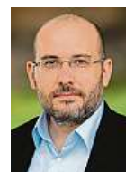
Miroslav Bobek Zoo Praha