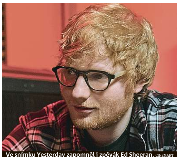
Ve snímku Yesterday zapomněl i zpěvák Ed Sheeran.

Tento žánr se dá totiž pojmut nejen komediálně jako ve filmech 50x a stále poprvé či animáku Hledá se