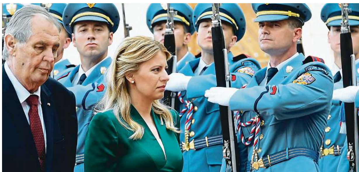
Nová slovenská prezidentka Zuzana Čaputová dorazila na první oficiální návštěvu České republiky. Více čtete na straně 4.

Úraz a léčba v zahraničí. Bez cestovního pojištění mohou české turisty vyjít pořádně draho. Trable. Plavky ucpaly odpad a vytopily hotel. Kuriózní případy. Srážka s nosorožcem nebo opáření horkým bahnem STRANA 6