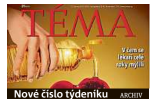
Nové číslo týdeníku ARCHIV