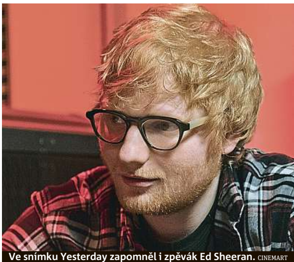
Ve snímku Yesterday zapomněl i zpěvák Ed Sheeran.

Tento žánr se dá totiž pojmut nejen komediálně jako ve filmech 50x a stále poprvé či animáku Hledá se