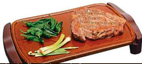
Pochoutky připravené na terakotě

Krásné počasí, rozkvetlé zahrádky a prázdná v žaludku. To vše dohromady vybízí v těchto slunečných dnech mnoho lidí ke grilování. Co když ale z různých důvodů nechcete používat klasický gril na uhlí? Jde to i jinak. Masivní boom v posledních týdnech zažily terakotové grily. Terakota je druh jílu, ze kterého se vyrábí speciální velmi odolná keramika, jež se již po celá staletí používá k vaření. Skvěle totiž odolává teplotu a zároveň dává připravovaným pokrmům jedinečnou chuť. I tyto vlastnosti vedly firmu Jata k tomu, že z terakoty vyrábí desky svých elektrických grilů.