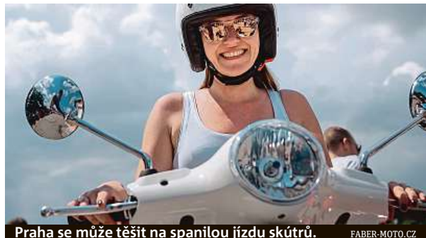
Praha se může těšit na spanilou jízdu skútrů.