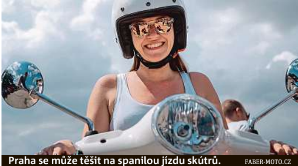
Praha se může těšit na spanilou jízdu skútrů. FABER-MOTO.CZ