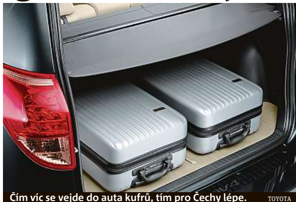
Čím víc se vejde do auta kufrů, tím pro Čechy lépe.

Na čtyřech kolech cestujeme na dovolenou dvakrát víc než letadlem. Vyplývá to z průzkumu společnosti NMS Market Research. Hlavním kritériem, proč volíme jako dopravní prostředek vůz, je pohodlí a také celková cena přepravy pro celou rodinu. „Při pořizování auta je pro Čechy jedním z hlavních kritérií velikost úložného prostoru,“ říká Jitka Jechová, mluvčí Toyota ČR. I proto, aby se tam vešlo třeba vlastní jídlo. Ale to v současnosti vozí už jen desetina našich turistů. PH