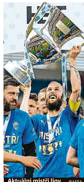
Aktuální mistři ligy MAFRA