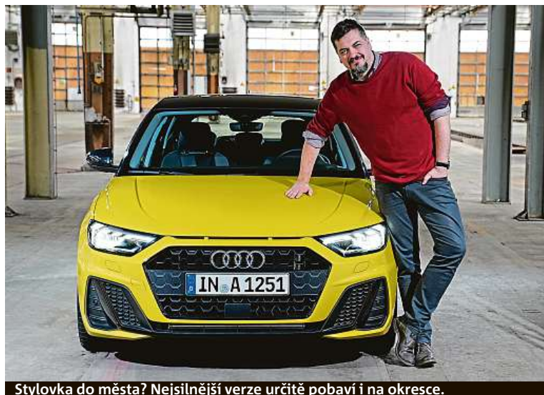
Stylovka do města? Nejsilnější verze určitě pobaví i na okresce.