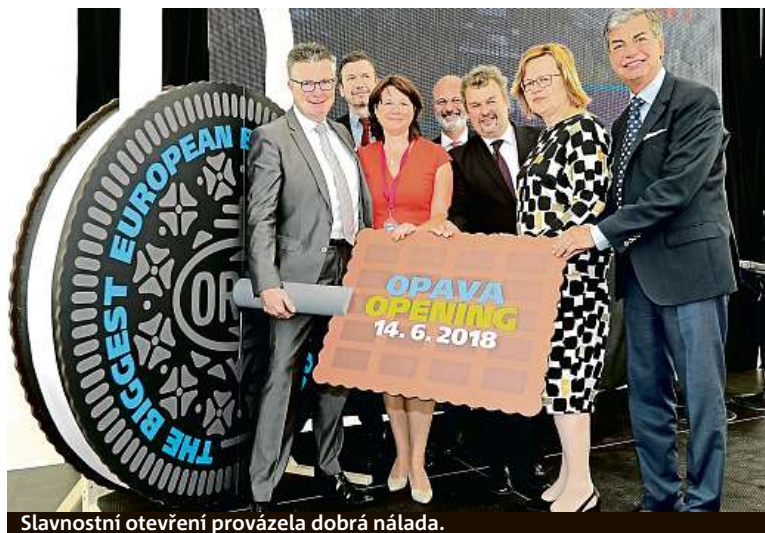
Slavnostní otevření provázela dobrá nálada.