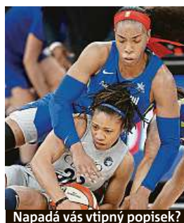
Napadá vás vtipný popisěk?

f Napište bublinu a reagujte na sloupek na: www.facebook.com/denikmetro