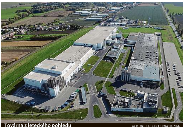
Továrna z leteckého pohledu