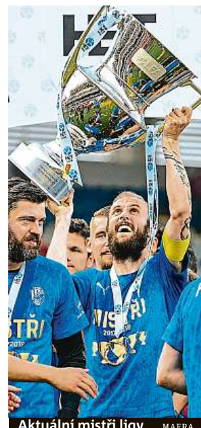
Aktuální mistři ligy MAFRA