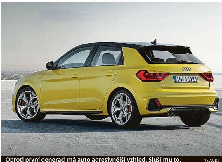
Oproti první generaci má auto agresivnější vzhled. Sluší mu to.