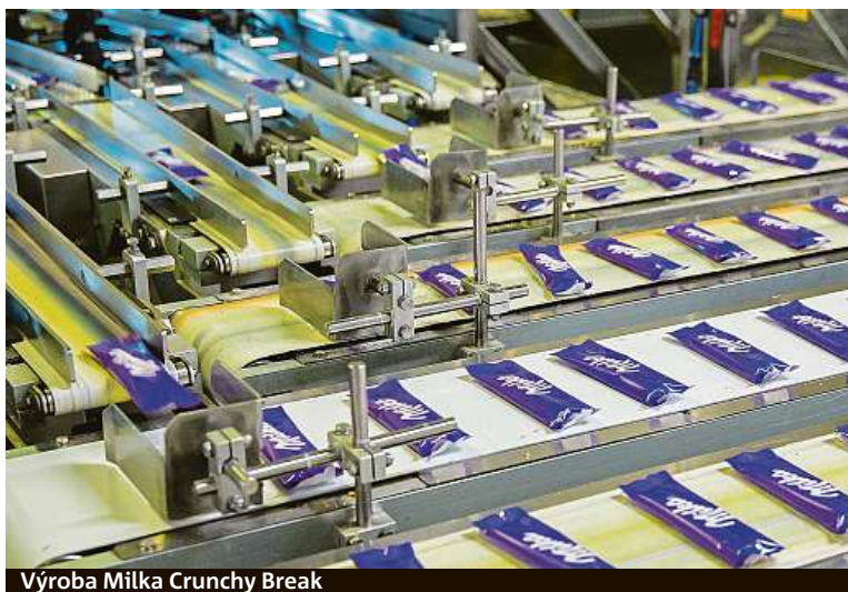
Výroba Milka Crunchy Break