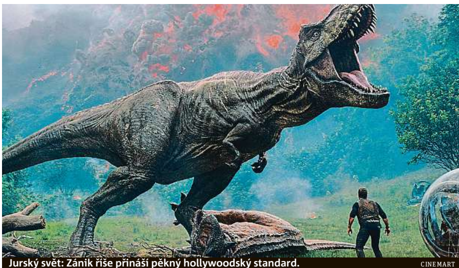
Jurský svět: Zánik říše přináší pěkný hollywoodský standard.

Film Jurský svět: Zánik říše začíná čtyři roky po jedničce. Na exotickém ostrově, kde prosperoval unikátní zábavní park Jurský svět, se probudila tamní sopka. Dinosaurům, kteří na konci jedničky ostrov ovládli, tak už podru-