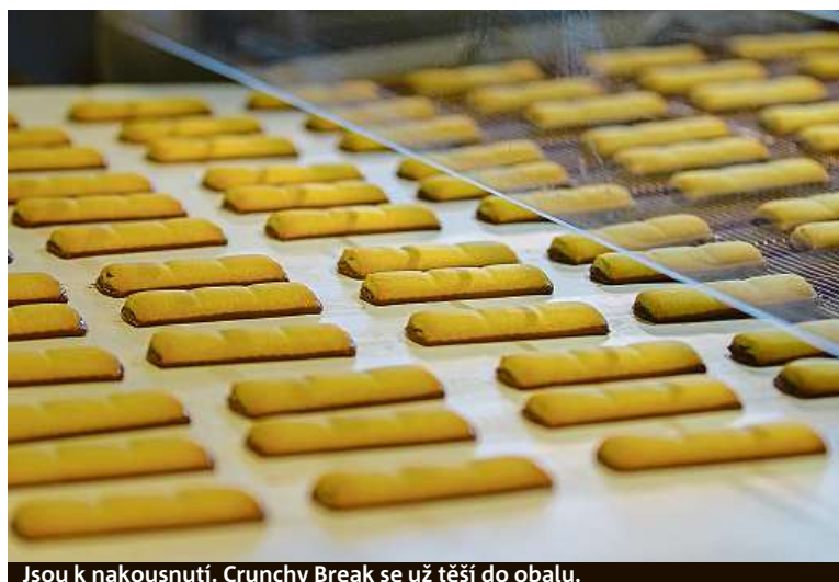
Jsou k nakousnutí. Crunchy Break se už těší do obalu.

„Významných investorů, kteří stavějí na tradici Moravskoslezského regionu a jsou zároveň stabilním zaměstnavatelem, si samozřejmě velmi vážíme,“ říká hejtmán kraje Ivo Vondrák. „Lidé, kteří pracují ve velkých průmyslových podnicích, jako je například Mondelez International, mají možnost ohromného osobního rozvoje včetně získání specifických výrobních a technických znalostí a schopností. V prostředí těchto mezinárodních firem oceňují také aktivní vytváření příležitostí pro získávání pracovních zkušeností v zahraničí. Rozvoj této lokální továrny, která má ovšem v současnosti už evropský význam, je jistě prospěšný pro celý náš kraj a jeho budoucnost,“ dodává hejtmán kraje.