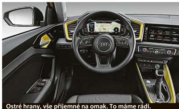
Ostré hrany, vše příjemné na omak. To máme rádi.

Nabídka motorů je zatím omezená na čtyři verze. Základem je tříválec 1.0 TSI s 95 koňmi a silnější kolega nalaďený na 115 koňů. Pak tu máme čtyřválec 1.5 TSI se 150 koňmi a na špici trůní zmíněný dvoulitrový motor z VW Pola GTI. Ten má výkon 200 koňů a 320 Nm. Žádná z verzí nebude mít víceprvkové zavěšení kol, všude bude jen torzní příčka. Do autosalonů přijde novinka na podzim. PETR HOLEČEK