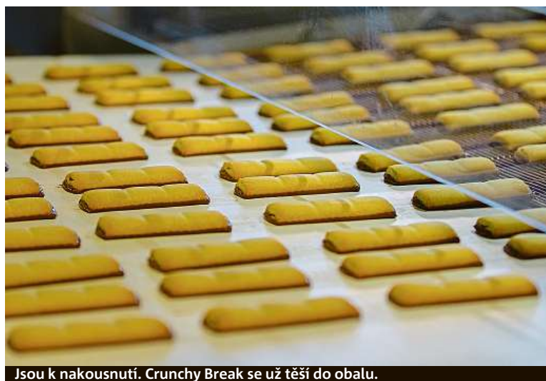
Jsou k nakousnutí. Crunchy Break se už těší do obalu.

„Významných investorů, kteří stavějí na tradici Moravskoslezského regionu a jsou zároveň stabilním zaměstnavatelem, si samozřejmě velmi vážíme,“ říká hejtmán kraje Ivo Vondrák. „Lidé, kteří pracují ve velkých průmyslových podnicích, jako je například Mondelez International, mají možnost ohromného osobního rozvoje včetně získání specifických výrobních a technických znalostí a schopností. V prostředí těchto mezinárodních firem oceňují také aktivní vytváření příležitostí pro získávání pracovních zkušeností v zahraničí. Rozvoj této lokální továrny, která má ovšem v současnosti už evropský význam, je jistě prospěšný pro celý náš kraj a jeho budoucnost,“ dodává hejtmán kraje.