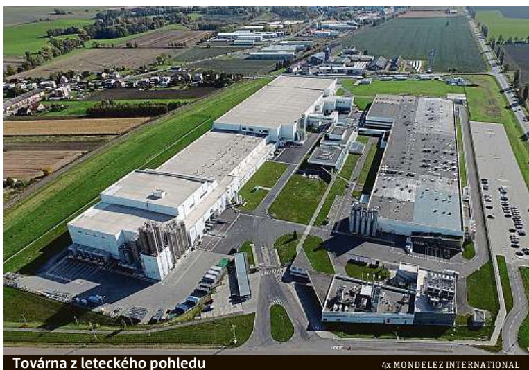
Továrna z leteckého pohledu