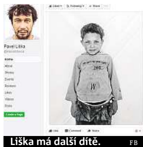
Liška má další dítě.

banonu spolu s někdejší členem prestižní fotografické agentury Magnum Photos Johnem Vinkem. Do virtuální výstavy se také zapojili například herec Pavel Liška, slovenský prezident Andrej Kiska či zpěvák Richard Müller. Více na www.tojemojedite.cz . MET