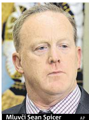
Mluvčí Sean Spicer

Spicer čelí kvůli svému vystupování před novináři kritice, sám prezident za něj údajně stojí. Podle médií je