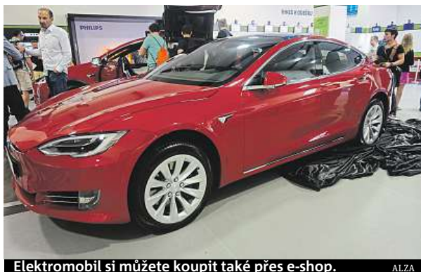
Elektromobil si můžete koupit také přes e-shop. ALZA

Poslední, co podle něj odrazuje zákazníky, je malá nabídka vozů a jejich dostupnost. To chce změnit internetový obchod Alza.cz, který od včerejška nabízí elektromobily Tesla S a Tesla X. „Prodej elektromobilů jsme zavedli na základě požadavků zákazníků. Koupit u nás auto je velmi snadné. Vůz je k dodání do