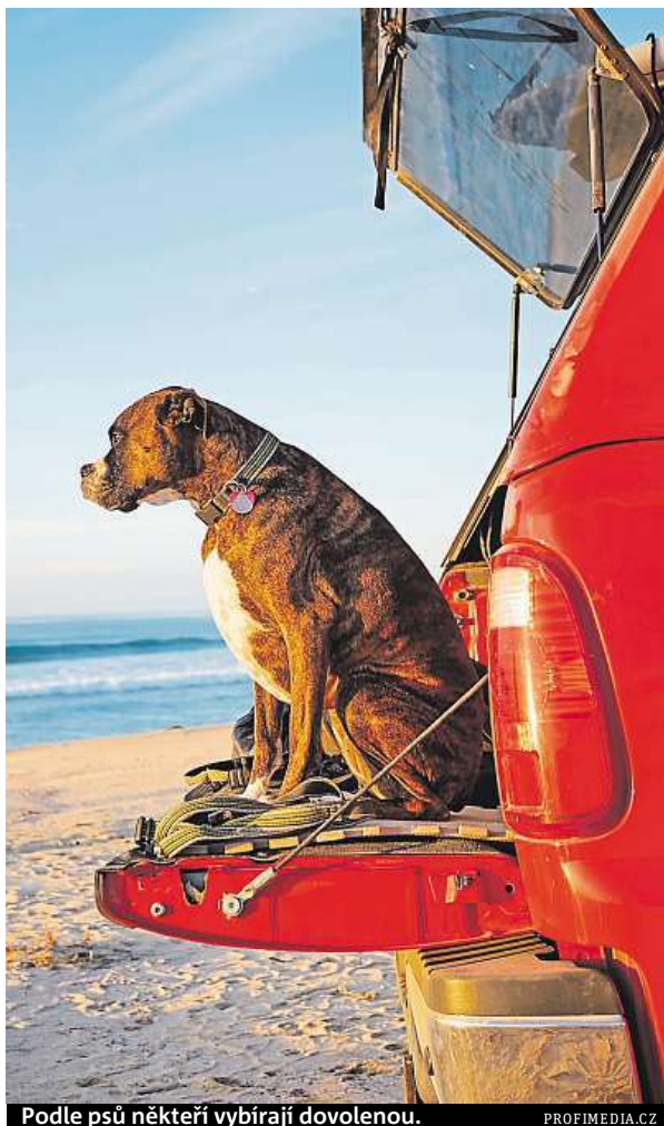
Podle psů někteří vybirají dovolenou.

Další riziko představují komáři a jiný bodavý hmyz. Několik druhů komárů může přenášet dirofilariózu – srdeční červivost, jejíž severní hranice výskytu se už posunula z jižní Evropy až na území Maďarska. Flebotomové, jejichž populace rovněž narůstá, jsou komárci přenášející leishmaniózu. Případů obou zmíněných onemocnění u nás každoročně přibývá v souladu s rostoucím počtem psů, kteří se svými majiteli navštívili jižní země. Proto je nutné zvolit vhodný antiparazitární prostředek. Třeba obojek může být psovi nepříjemný a může jej dokonce ztratit. „Na antiparazitárních přípravcích rozhodně nedoporučuji šetřit, raději si pořiďte kvalitní značku. Aktuálním trendem jsou pipety Frontline TriAct, kterými ochranný přípravek aplikujete přímo na kůži. Pes pak nemusí nosit speciální obojek,“ radí Jana Jerie z chovatelské stanice Anajsla. MET