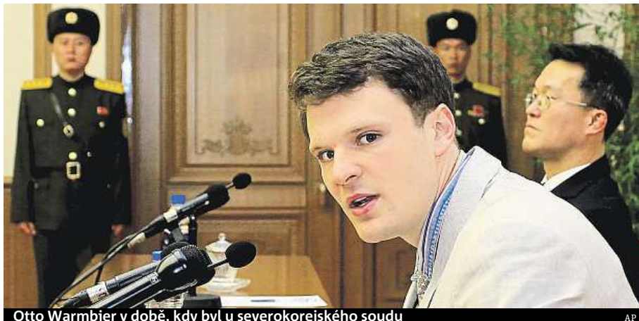
Otto Warmbier v době, kdy byl u severokorejského soudu

Mladík se do vlasti vrátil 13. června ve špatném zdravotním stavu a kómatu. Léka-