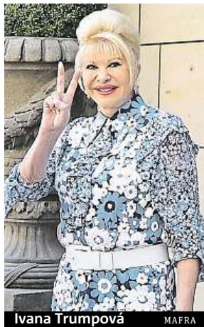
Ivana Trumpová

Nejlepšího hospodářského výsledku před zdaněním dosáhla loni také Škodovka, a sice 30,8 miliardy korun.