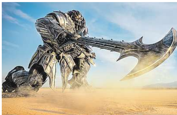
V dalším díle se představí i nová postava.

Vůdce Autobotů Optimus Prime zmizel. Světem zmítá zuřivá válka mezi lidmi a ostatními Transformersy. Pátý film Transformers, který přímo navazuje na čtvrtý díl, jenž nesl podtitul Zánik, asi nemohl mít beznadějnější výchozí situaci. Režisér Michael Bay, který je duchovním otcem téhle velmi úspěšné série, tvrdí, že pátý díl je jeho posledním a že chce proto odejít s „pořádným ohňostrojem“. V jeho pojetí zní ta slova fanouškům velmi vý-