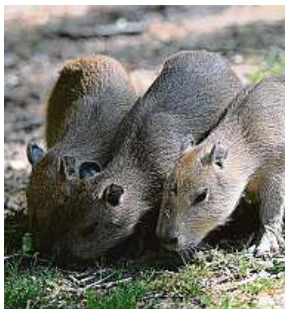
Mláďata zlínských kapybar

Zlínská zoo chová kapybary 35 let a úspěšně odchovává již 80 mláďat. Ještě nikdy se však podle Štrauba neodchovalo šest mláďat najednou.