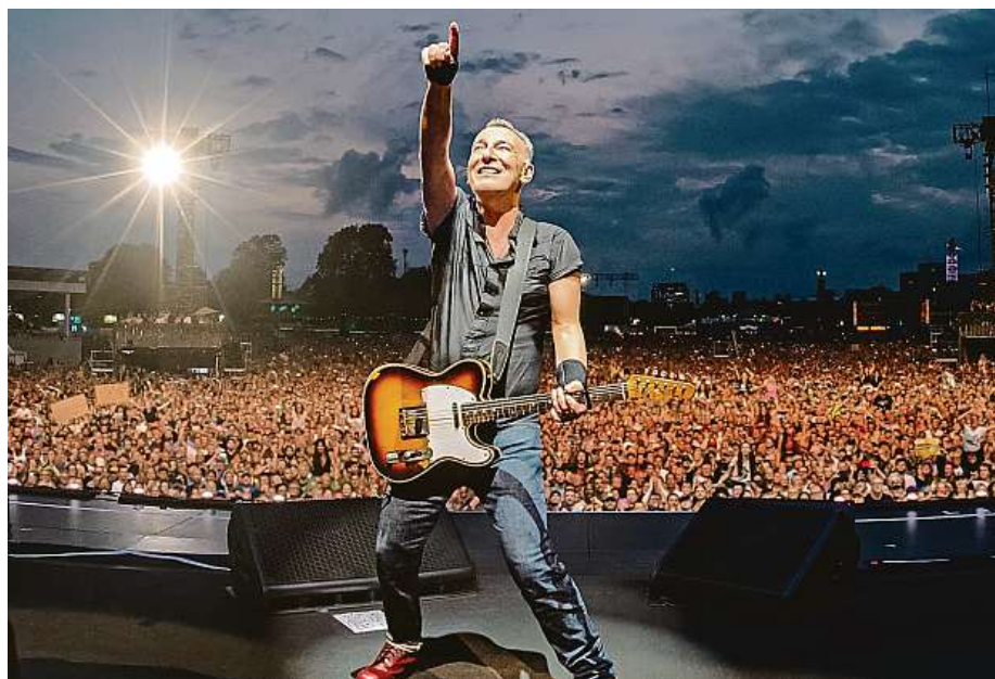
Za Springsteenem se do Letňan sjedou i fandové z Polska, Rakouska, Slovenska či Německa.

Rocker Springsteen, přezdívaný Boss, získal 20 cen Grammy, Oscara, dva Zlaté glóby a zvláštní cenu Tony. V roce 1999 byl uveden do Rock'n'rollové síně slávy – v roce 2014 jej následovala jeho doprovodná skupina The E Street Band. Roku 2013 obdržel vyznamenání Kennedyho centra a o tři roky později mu prezident Barack Obama udělil Prezidentskou medaili svobody, nejvyšší civilní ocenění v zemi. Loni Springsteena v Bílém domě