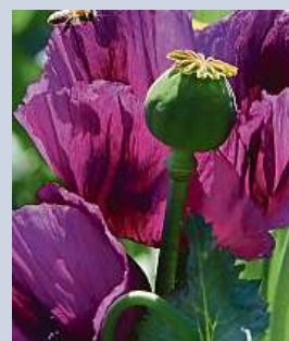
Pole pod Čekyňským kopcem s květy českého máku

Brazilský vědec šlápl více než 40tisíckrát na jedovatého hada křovináře žararaku. Chtěl vyzkoumat důvody, proč někteří hadi koušou a jiní ne. Hadi nebyli zraněni. Výsledek studie říká, že čím je had mladší, tím se zvyšuje pravděpodobnost, že zaútočí a člověka kousne. Nejagresivnější jsou mladé samice, uvádí studie. ČTK