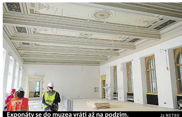
Exponáty se do muzea vrátí až na podzim.

Není bez zajímavosti, že původní technické zařízení Národního muzea prošlo předtím, než skončilo ve sběru