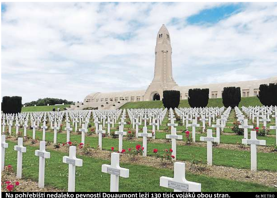
Na pohřebišti nedaleko pevnosti Douaumont leží 130 tisíc vojáků obou stran.

Určitě není radno vynechat Mémorial de Verdun, hlavní muzeální expozici asi tři kilometry od města, měla by být v pořadí na prvním místě. Francouzi si dali záležet, procházíte tu časem i zážitky, které vám zprostředkují nejen vystavené zbraně, ale především velké množství osobních předmětů, které na obou stranách bojové linie pomáhaly vzájemně se masa-