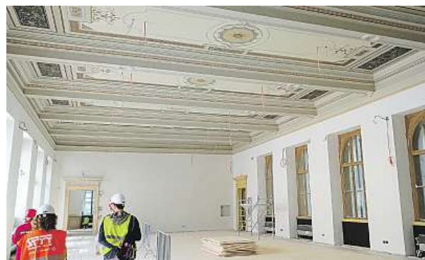
Exponáty se do muzea vrátí až na podzim.

Není bez zajímavosti, že původní technické zařízení Národního muzea prošlo předtím, než skončilo ve sběru