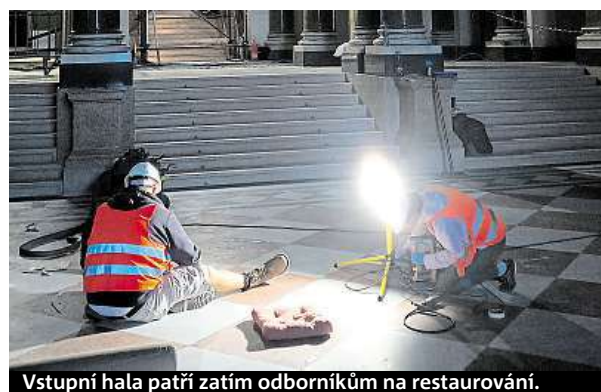
Vstupní hala patří zatím odborníkům na restaurování.

a na skládkách, rukama odborníků z Národního technického muzea. Ti všechno zajímavé, co dokládá technický um našich předků, vytrídili pro případné budoucí výstavy nebo do stálé expozice.