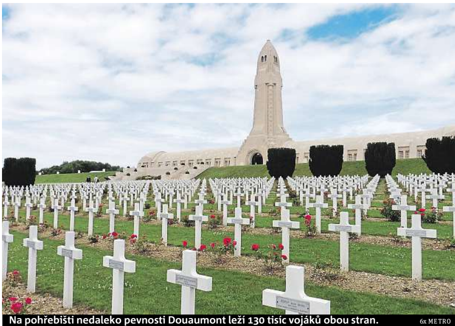
Na pohřebišti nedaleko pevnosti Douaumont leží 130 tisíc vojáků obou stran.

Určitě není radno vynechat Mémorial de Verdun, hlavní muzeální expozici asi tři kilometry od města, měla by být v pořadí na prvním místě. Francouzi si dali záležet, procházíte tu časem i zážitky, které vám zprostředkují nejen vystavené zbraně, ale především velké množství osobních předmětů, které na obou stranách bojové linie pomáhaly vzájemně se masa-