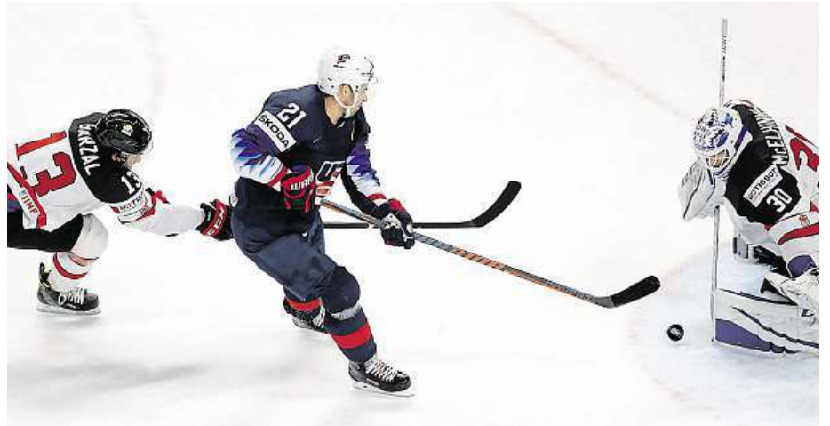
Američan Dylan Larkin se řítí na kanadskou branku.