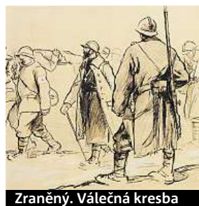
Zraněný. Válečná kresba

krujícím vojákům přežít týdny a měsíce v letních vedrech, podzemním bahně vodou zatopených zákopů i v zimní krajině. Kresby, dopisy, tabatěrky, čutory nebo prostřelené helmy vypovídají o utrpení víc než dost.