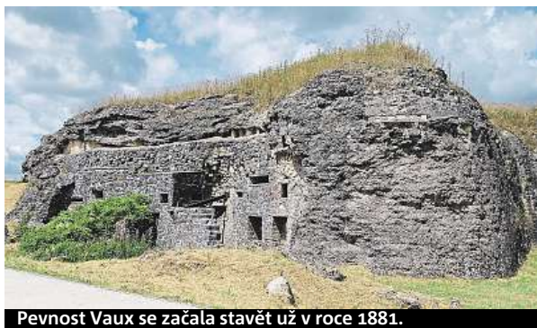
Pevnost Vaux se začala stavět už v roce 1881.