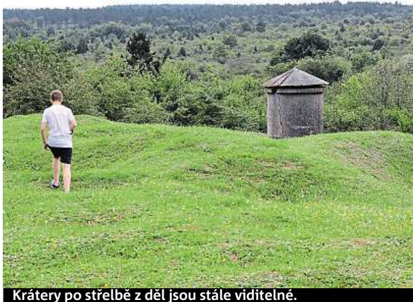
Krátery po střelbě z děl jsou stále viditelné.