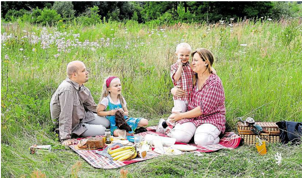
Nejzávažnějším z tradovaných omylů je tvrzení, že klíšťe můžeme chytit pouze v lese.

Kvůli typickým příznakům, jako je bolest hlavy, únava či mírně zvýšená teplota, lidé v mnoha případech zaměňují encefalitidu za chřipku a příznaky ignorují. Ve druhé fázi nemoci se obvykle přidává nevolnost, zvracení a v některých případech také křeče a rozmazané či dvojité vidění. Trvalé následky klíšťové encefalidity mohou být fatální – poruchy koncentrace, nálady či spánku, snížená výkon-