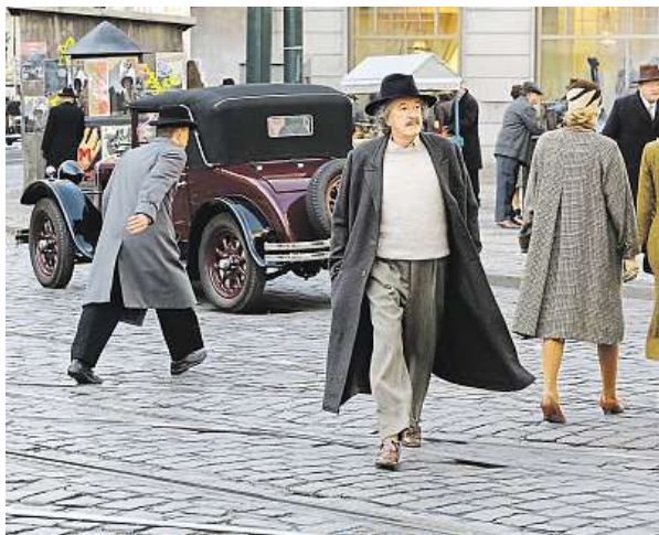
Geoffrey Rush jako Albert Einstein

Einstein v dopisech přátelům vysoce hodnotil Prahu jako město. Příteli Bessovi nadenatřicetiletý Albert Ein-