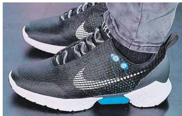
Tenisky pohání baterie, díky níž také svítí.