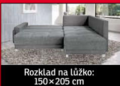
Rozklad na lůžko: 150 x 205 cm