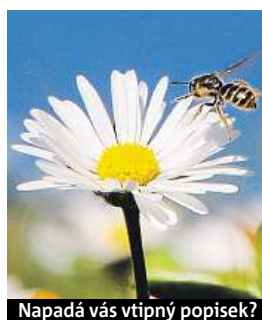
Napadá vás vtipný popisek?

Napište bublinu a reagujte na sloupek na: www.facebook.com/denikmetro