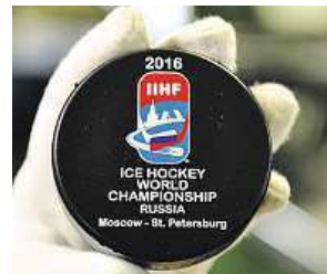
Puk pro MS v Rusku