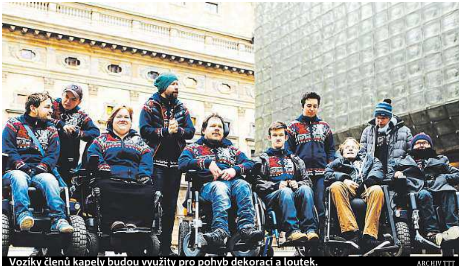
Vozíky členů kapely budou využity pro pohyb dekorací a loutek.