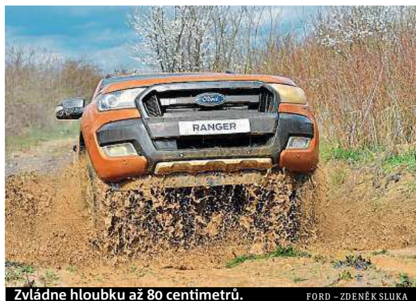
Zvládne hloubku až 80 centimetrů.