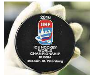
Puk pro MS v Rusku