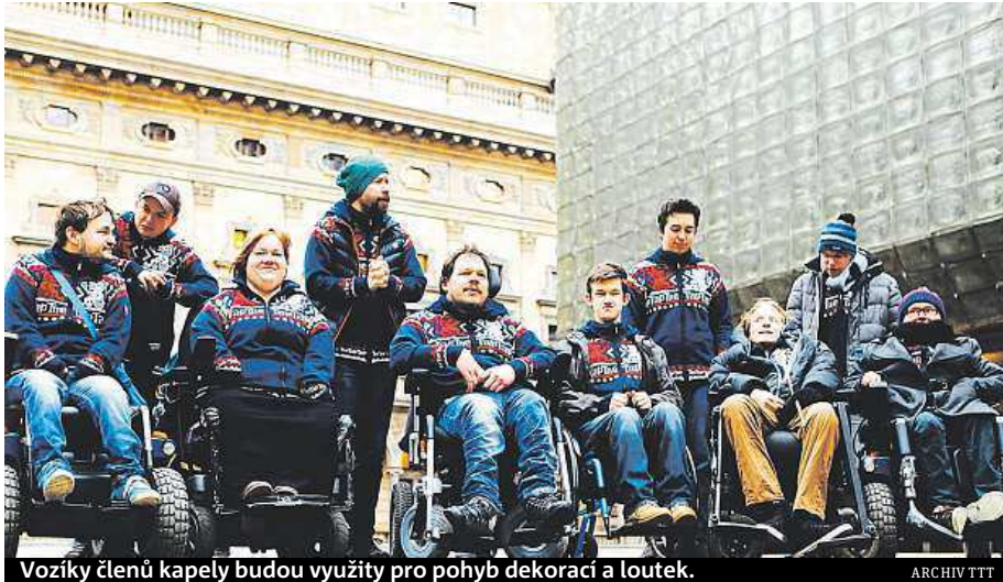
Vozíky členů kapely budou využity pro pohyb dekorací a loutek.