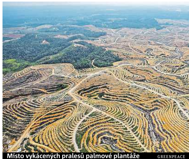
Místo vykáčených pralesů palmové plantáže