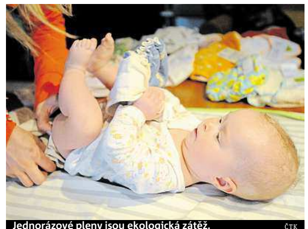
Jednorázové pleny jsou ekologická zátěž.

Podle organizátorů kampaň dítě za svůj život spotřebuje až tunu jednorázových plen. Jedná se prý o celkem problematickou ekologickou zátěž, která se rozkládá několik desítek let. Křešničková dodala, že látkové pleny navíc mají ještě další přednosti. „Jsou šetrnější k dětskému zdraví, nehrozí z nich tolik kožních onemocnění,“ podotkla.