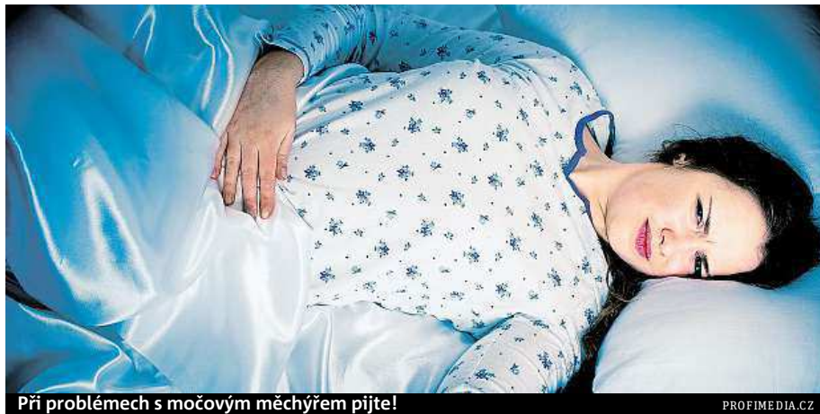
Při problémech s močovým měchýřem pijte!

To vše usnadňuje vstup infekce do močového traktu. Každý, komu je infekce močových cest diagnostikována, musí dostatečně pít. A to velmi. Musí do sebe dostat tolik tekutiny, aby vymočil 2,5 litru