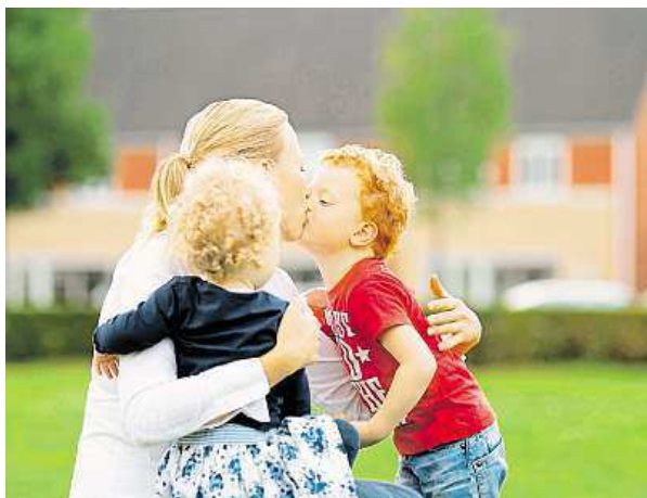
Vyšší Nizozemci mají více dětí.

Pro pochopení souvislosti mezi přirozeným výběrem a postavou výzkumníci posoudili různé údaje mezi 94 500 Nizozemci v letech 1935 až 1967. Ukázalo se, že během těchto tří desetiletí nejvíce dětí měli dlouháni a průměrně vysoké ženy. Nejplodnější muži vyčnívali až