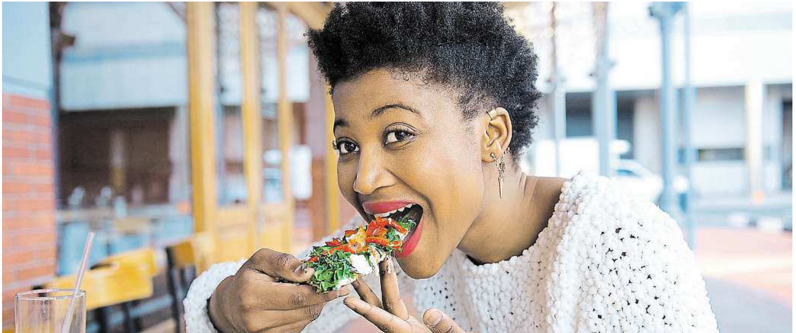
Can you imagine the world without pizza?