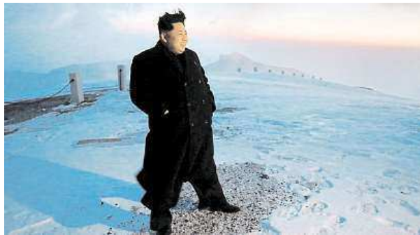
Kabát, lakýrky a hurá do 2750 metrů nad mořem.

Severokorejský vůdce Kim Čong-un se zřejmě nechal inspirovat svým ruským protějškem Vladimírem Putinem a chlubí se svými sportovními a hrdinskými činy. Nyní prý zdolal nejvyšší horu KJDR Pektu.