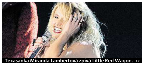
Texasanka Miranda Lambertová zpívá Little Red Wagon.

Jednatřicetiletá blondáta Texasanka Lambertová mimo jiné dominovala šesté jako nejlepší zpěvačka, počtvrté s nejlepším albem