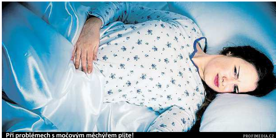
Při problémech s močovým měchýřem pijte!

To vše usnadňuje vstup infekce do močového traktu. Každý, komu je infekce močových cest diagnostikována, musí dostatečně pít. A to velmi. Musí do sebe dostat tolik tekutiny, aby vymočil 2,5 litru