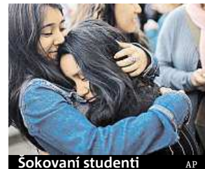
Sokovaní studenti AP

Trináctiletý mladík zabil včera ráno učitele v budově střední školy v barcelonské čtvrti Sant Andreu a nejméně čtyři další osoby zranil. Policie útočníka zadržela. Student přišel pozdě na hodinu, zaklepal na dveře, a když mu učitelka otevřela dveře, střelil ji kuší. Způsobil jí blíže nepřesněná zranění. Pak měl namířit zbraň na jednu ze studentek. Výkřiky ostatních přivolaly učitele z vedlejší třídy,