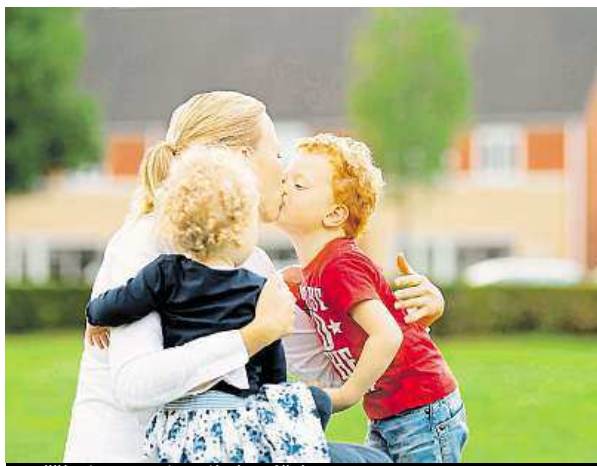
Vyšší Nizozemci mají více dětí.

Pro pochopení souvislosti mezi přirozeným výběrem a postavou výzkumníci posoudili různé údaje mezi 94 500 Nizozemci v letech 1935 až 1967. Ukázalo se, že během těchto tří desetiletí nejvíce dětí měli dlouháni a průměrně vysoké ženy. Nejplodnější muži vyčnívali až