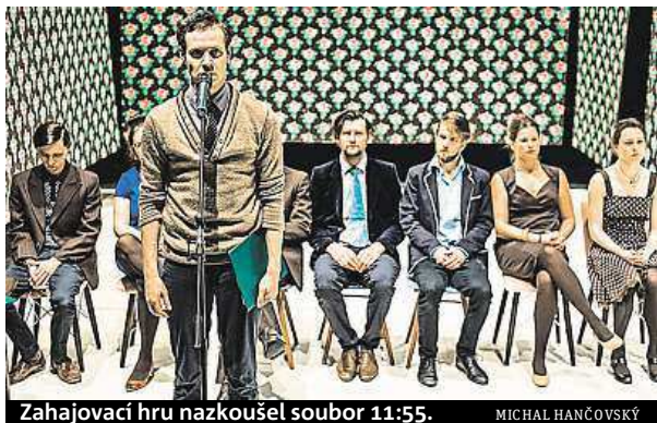
Zahajovací hru nazkoušel soubor 11:55.