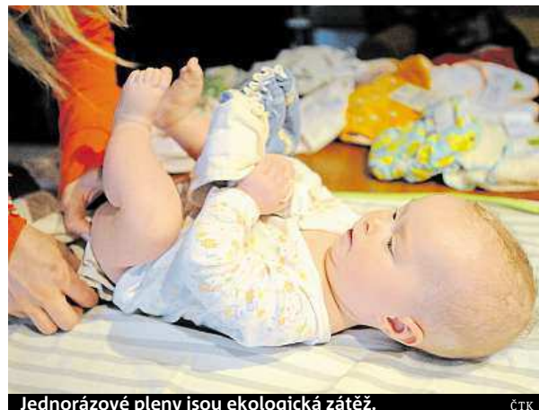
Jednorázové pleny jsou ekologická zátěž.

Podle organizátorů kampaň dítě za svůj život spotřebuje až tunu jednorázových plen. Jedná se prý o celkem problematickou ekologickou zátěž, která se rozkládá několik desítek let. Křešničková dodala, že látkové pleny navíc mají ještě další přednosti. „Jsou šetrnější k dětskému zdraví, nehrozí z nich tolik kožních onemocnění,“ podotkla.